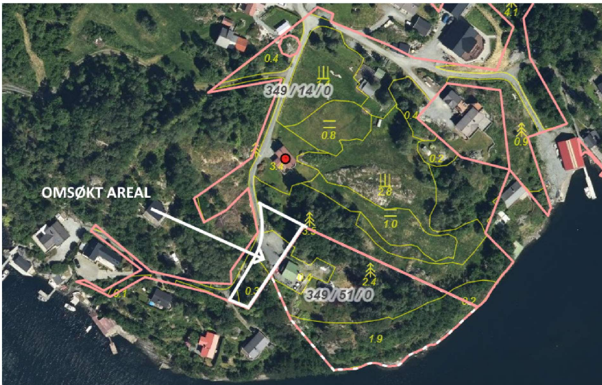
Fig. 2. Parsellen som er søkt frådelt inneheld ein del skog, oppstillingsplass for bilar og tilkomstveg til bnr. 51 som parsellen etter planen skal leggjast til.