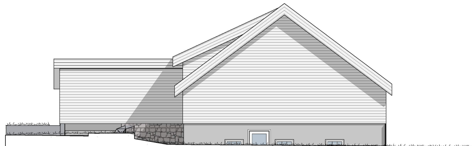
1:100 Fasade Sør