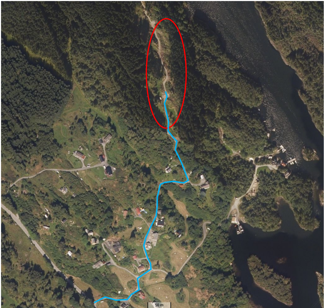
Figur 1 Flyfotoet viser det fremtidige utbyggingsområdet markert med rød sirkel samt tilkomst fra fylkesveg 561.