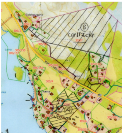
Bilde 1 -Teig A og B

Teig B. Om lag 112 daa skog/utmark Teig c: Om lag 75 daa skog i Oneset