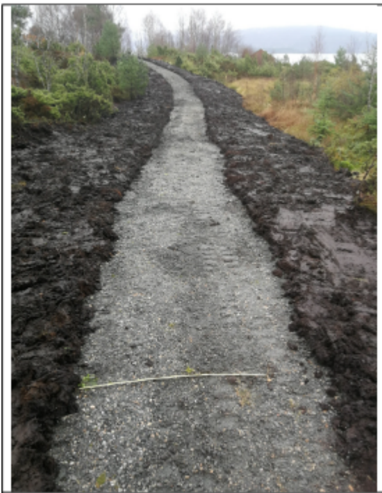
Bilde motteke 21.11.18

Men slik det viser seg i ettertid, så ser me at me skulle sperra gangveg fysisk med bom eller lagt steinar ned for å hindre at kjøretøy å kunne kjøre på gangveg, noko som igjen gjorde at gangveg gradvis blei bredere. Det er òg ein anna viktig grunn til at overskytande massar ikkje blei flytta, pga. unødig belastning på Den Trondhjemske Postveg, som me fekk uttrykkeleg beskjed om frå kulturminneavdelinga i Statens Vegvesen. På dette grunnlag ber eg dykk frafalle gebyrkravet i SAK 10 § 16-1 fyrste ledd, bokstav h nr 2 på kr 20 000,-.