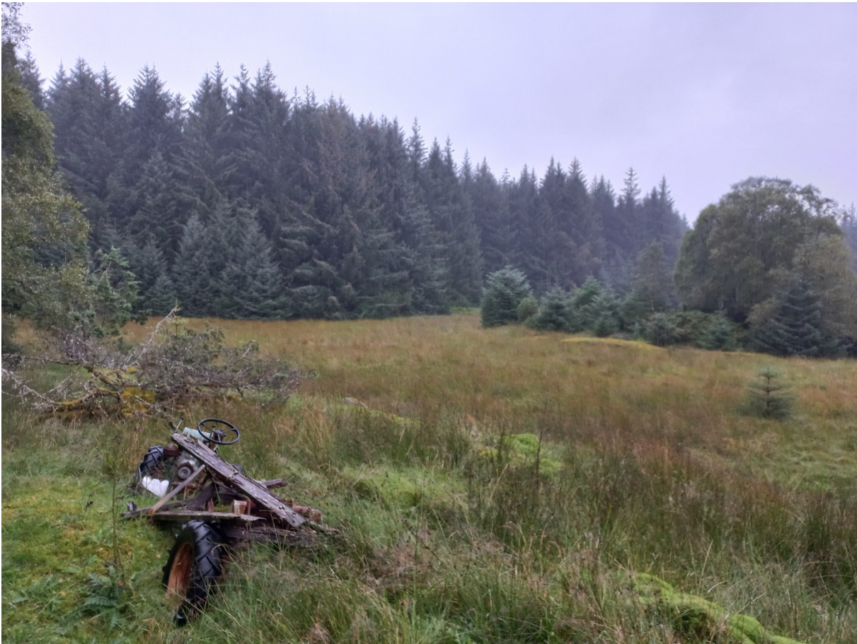
Fig. 5. Del av sitkagranfeltet.