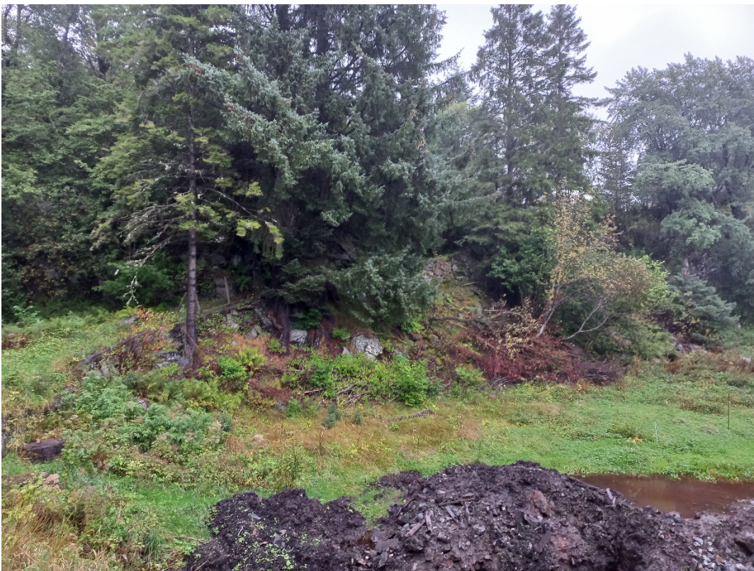
Fig. 3. Etter bekkekryssing skal vegen fylgje ein gamal smal veg oppover ei bratt, men kort li.