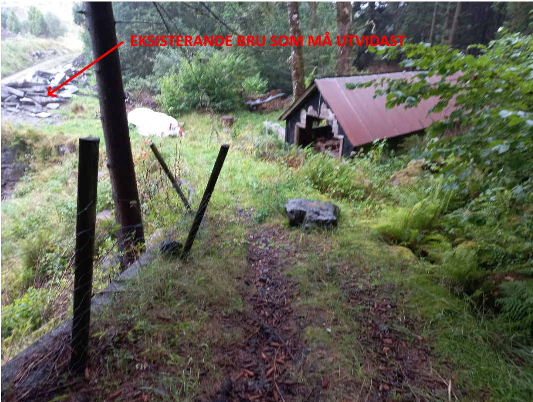
Fig. 2. Vegen må krysse ein bekk der det i dag er ei eldre bru som må utvidast. Vidare skal den fylgje oppover ei bratt li (mot fotografen) som synt i fig. 2.