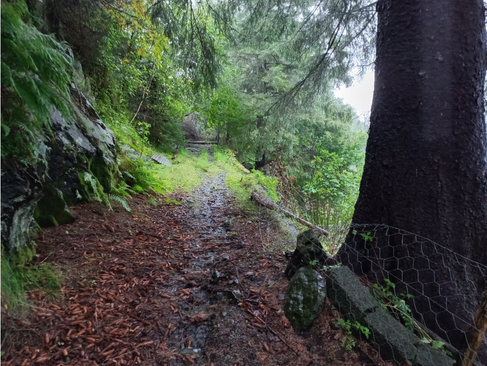
Fig. 4. I lia må vegen eksisterande veg utvidast. Av tryggleiksgrunnar er det viktig at skråninga langs høgre side i biletet vert dimensjonert og tilpassa vegstandarden og dei køyrety som etter planen skal køyre der.