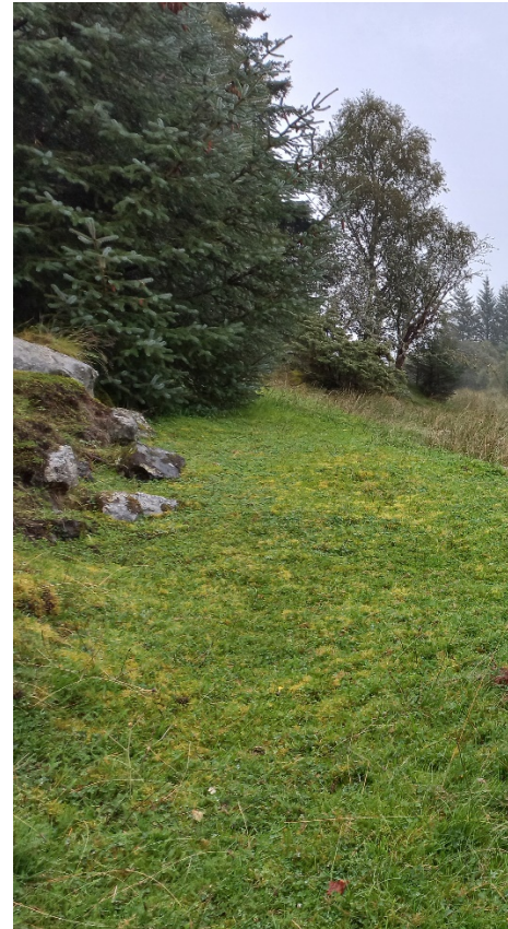
Fig. 5. Ovanfor lia synt i fig. 3-4 er det lett terreng for vegbygging. Her ved den gamle innmarka der vi skimtar sitkagranfeltet bak lauvskogen. Det er usikkert om det vert veg hit.