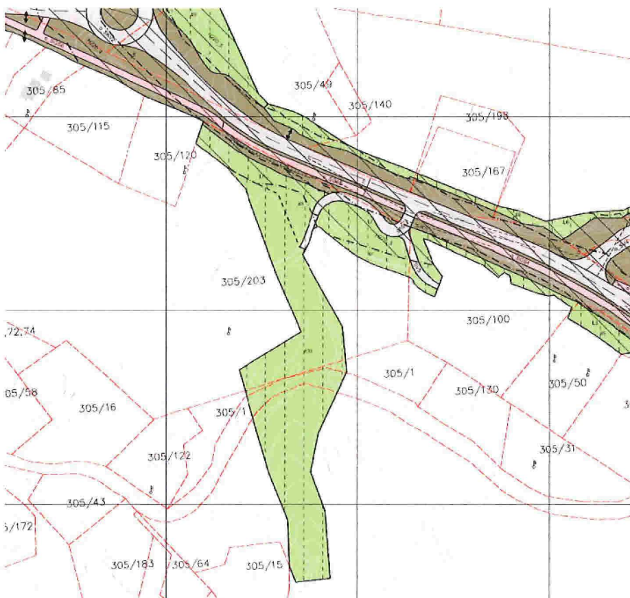
Utsnitt av plankart alternativ A2 med utvidinga

I dette alternativet for ny fv. 564 blir det bygd ny rundkøyring om lag 250 m vest for krysset med fv. 5308 Vestbygdsvegen. Nye vegar vil gi litt auka tilførsel av overvatn i området. I dag blir overvatn frå skogsområdet nord for fv. 564 ført inn i gamle, lukka kisteveiter som går under jordbruksområdet sør for fv. 564. Tilstanden til desse gamle lukka veitene er usikker, og det er uklart om dei har kapasitet til å ta i mot meir overvatn. Vi legg derfor til grunn at det kan bli nødvendig å leggje nye røyr i same trase. Eksisterande kisteveiter er opne i lia lengre ned, frå ein sti som går ned til nokre naust ved Sørastøa. Auken i tilførsel av overvatn er liten, og utbetringa av overvasssystemet er berre aktuelt der kisteveitene er lukka og i for dårleg stand. Lengda på strekinga der nye røyr kan vere nødvendig er om lag 200 - 250 m. Ved kryssing av kommunal veg Fløksand kan det ev. vere nødvendig med ein stikkledning pga. lågbrekk i terrenget.