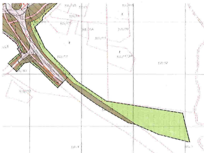
Utsnitt av plankart alternativ A1 med utvidinga

I dette alternativet for ny fv. 564 blir det bygd ei ny rundkøyring om lag der krysset med fv. 5308 Vestbygdvegen ligg i dag. Nye vegar inn til kryssområdet vil gi litt auka tilførsel av overvatn inn i området. For å sikre god drenering ut frå området legg vi opp til ny overvassleidning søraustover langs dagens fv. 564 i om lag 200 - 250 m lengde til ein eksisterande vasskum. Denne kummen skal senkast om lag 1 m, og vi vil leggje nytt røyr i om lag 100 m lengde fram mot søkk/bekk som renn ned til myra og den vesle elva som kjem frå Brakstadvatnet.