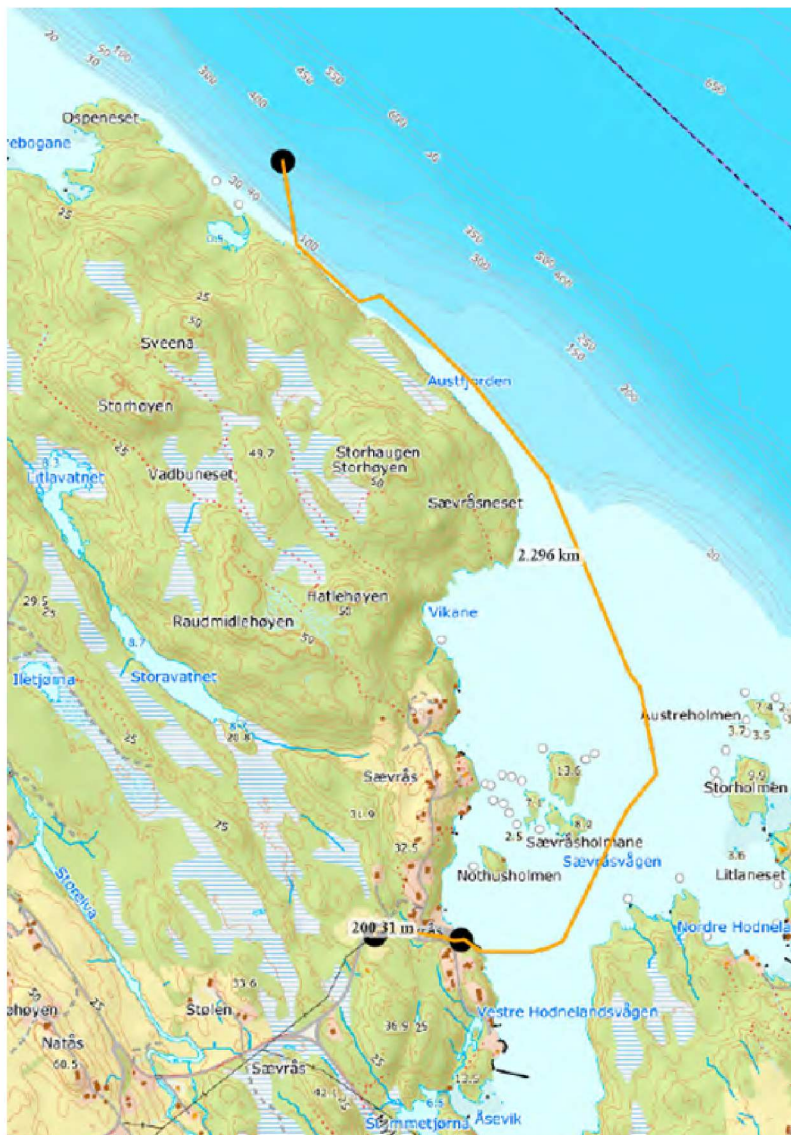
Kart 1: Sjøbalettrasé (Eide)

Sjøkabelen er koblet til områdekonsesjonær BKK i nettstasjon i Sævråsvåg. Eide har i forkant av bygging av anlegget avklart med BKK at det er tilstrekkelig kapasitet i overliggende nett, samt lagt ved dokumentasjon på enighet om grensesnitt.