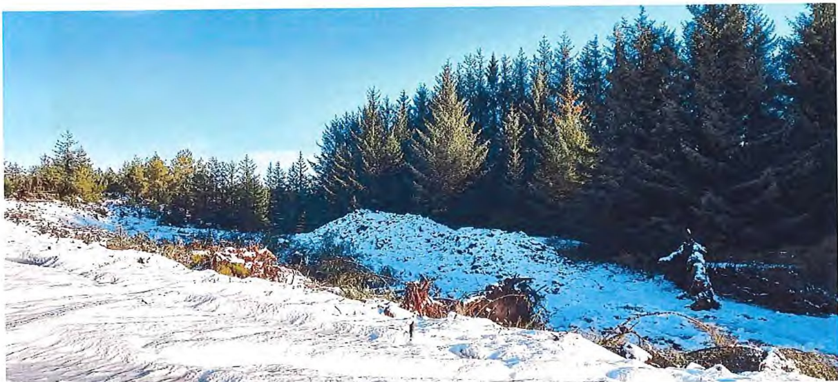
Fig. 5. Her er matjordlaget teke vare på. Det skal planerast ut med tilkøyrtte massar og der matjordlaget vert lagt oppå. Dette vil gje eit godt beite.