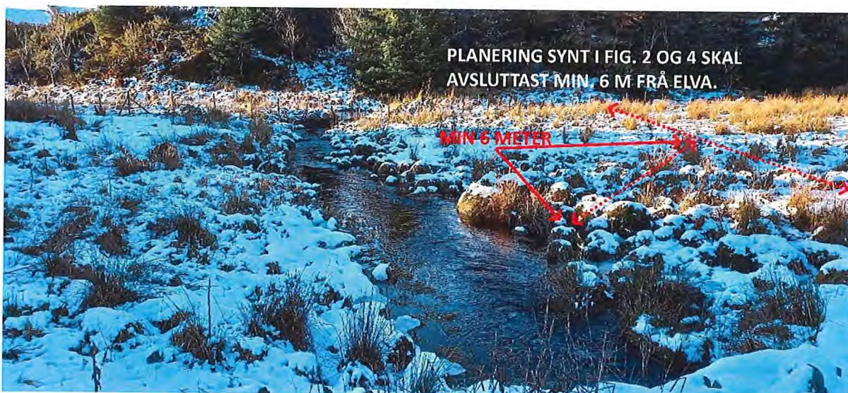
Fig. 3. Nedstraums elvekryssinga skal bekken framleis liggje open som i dag, men den må kunne reinskast når det er naudsynt. Det gjeld òg for den kommunale eigedomen på andre sida av gjerdet. I Høgre biletkant vil planeringa/fyllinga synt i fig. 4 kome ned mot elva og skal avsluttast ikkje nærare enn 6 m frå elva.