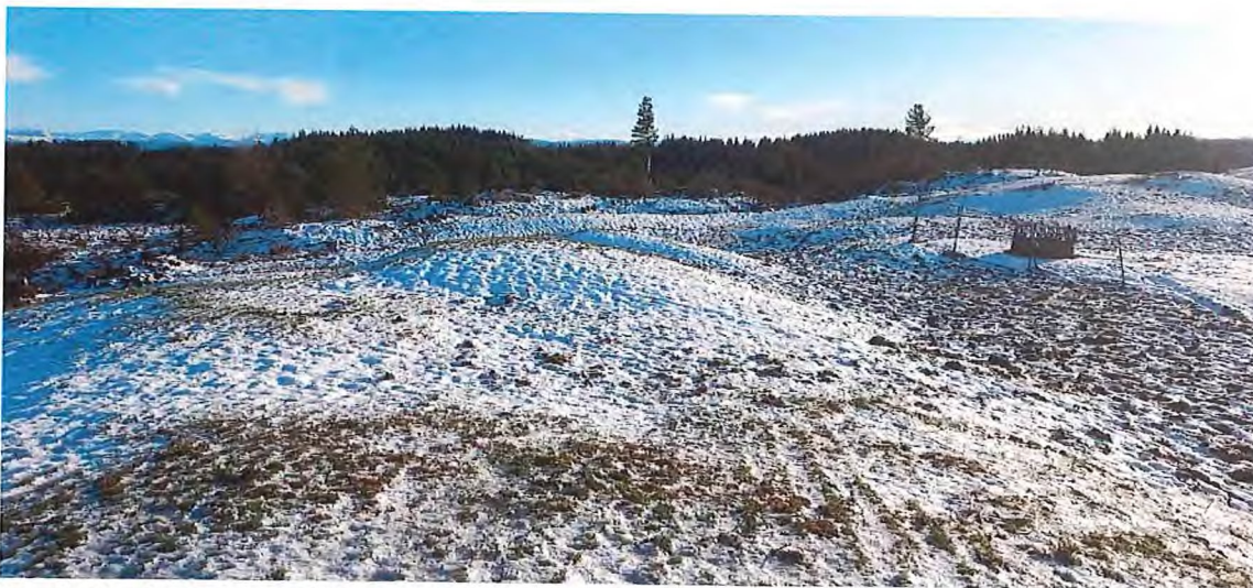
Fig. 8. Nordaust for området ser beitet slik ut i dag.