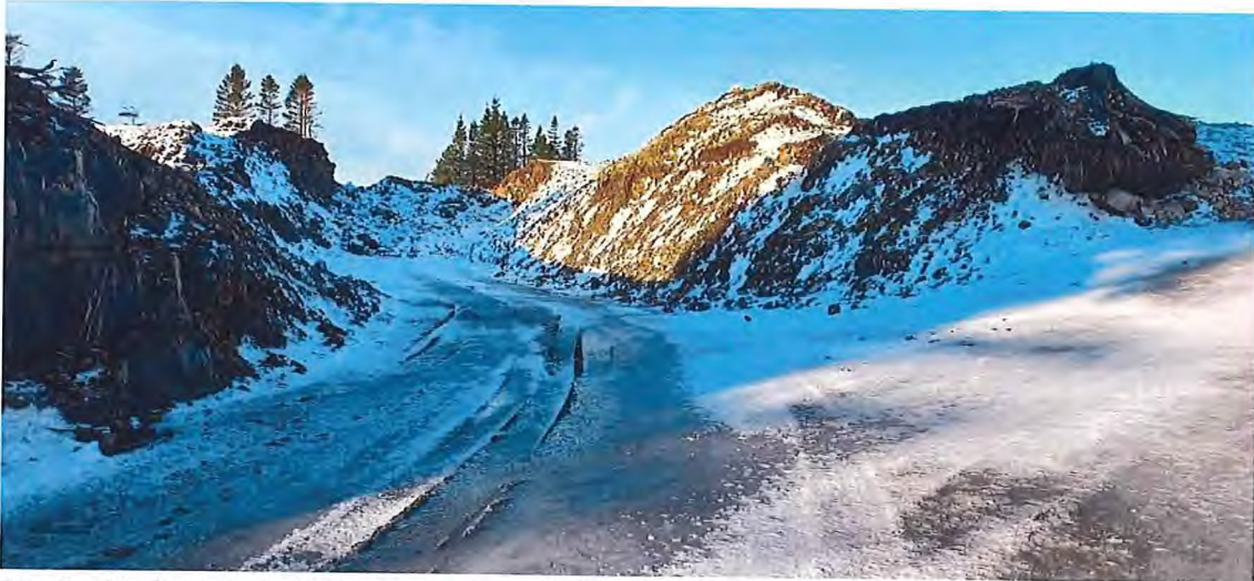
Fig. 6. Skjeringane skal flatast ut noko og fyllast på med jord. Dette for å dempe skjeringane. Vegen skal halde fram inn på naboeigedom (gnr. 156, bnr. 17) og samtykkje frå eigar må vere på plass før vegbygginga startar opp.