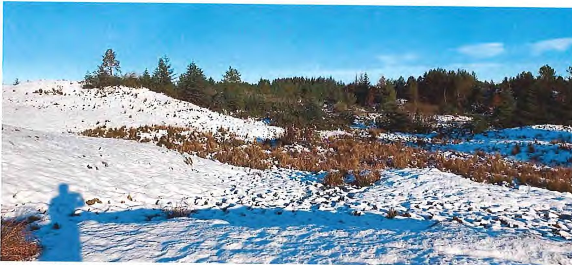
Fig. 7. I dette området vil det verte lagt eit tynnare lag med masse i dei våte søkka.