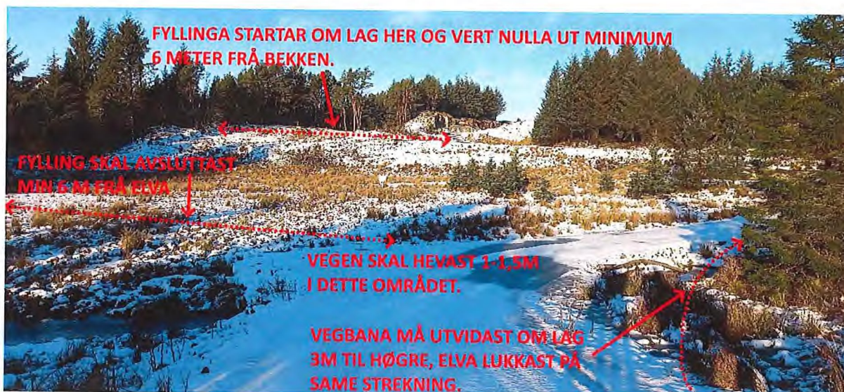
Fig. 2. Bakken lengst borte skal jamnast (planerast) ut om lag ned mot der den stripla lina markerer at bakkenivået vert nådd. Sjå òg fig. 4. I tillegg må vegen i framkant utvidast i innersvingen. Dette då den i dag er for krapp slik at det ber utfordrande å kome forbi med større bilar. Elva som vegen kryssar her, må leggjast i røyr om lag 3 meter utover dagens situasjon dvs frå vegen og om lag til den stripla lina. Vegen må òg hevast om lag 1-1,5 m i denne svingen. Utover dette skal elva framleis liggje open som i dag, men den må reinskast når det er naudsynt. I dette området ligg det ein kommunal vassleidning som det lyt takast omsyn til.