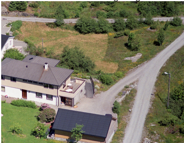
Figur 3 Flybilete frå 1982-84. Omsøkt veg til høgge.

Søkjar hevdar at vegen vart bygd før arealet vart sett av til LNF formål i kommuneplan for Lindås. (Tidlegare generalplan). Etter det administrasjonen finn vart første generalplanen for Lindås vedteken 15.05.1983 og godkjent av Miljøverndepartementet 23.04.1985. I gamle flybilete teke i tidsrommet 1982-1984 viser vegen. Administrasjonen finn derfor at vilkåret i læra om at vegen må vera bygd før arealet vart sett av til LNF formål er stetta. Arealet har heile tida vore brukt som tilkomstveg til eigedomane i feltet.