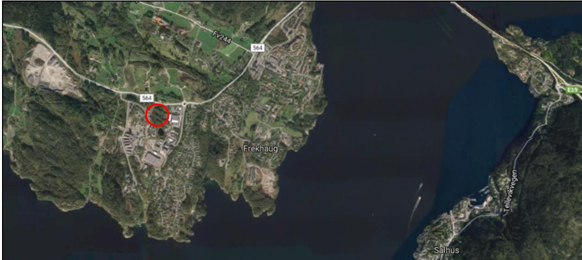
Figur 1: Planområdet i Mjåtveitmarka i Alver kommune (markert med rød sirkel) ligger vest for kommunesenteret Frekhaug. Øverst til høyre sees Nordhordlandsbrua.

tilfellet på eksisterende registreringer i området, og befaring utført under gode værforhold på egnet årstid 11. juni 2017. De nasjonale miljødatabasene Naturbase 1 , Artskart 2 og Kilden 3 er benyttet. Andre kilder refereres fortløpende. I desember 2021 ble ny informasjon om elvemusling tatt inn fra notat om avrenning, som følger plansaken. Rapporten ble også oppdatert etter siste gjeldende rødliste av nov. 2021, inkl. sjekk av Artskrat og Naturbase.