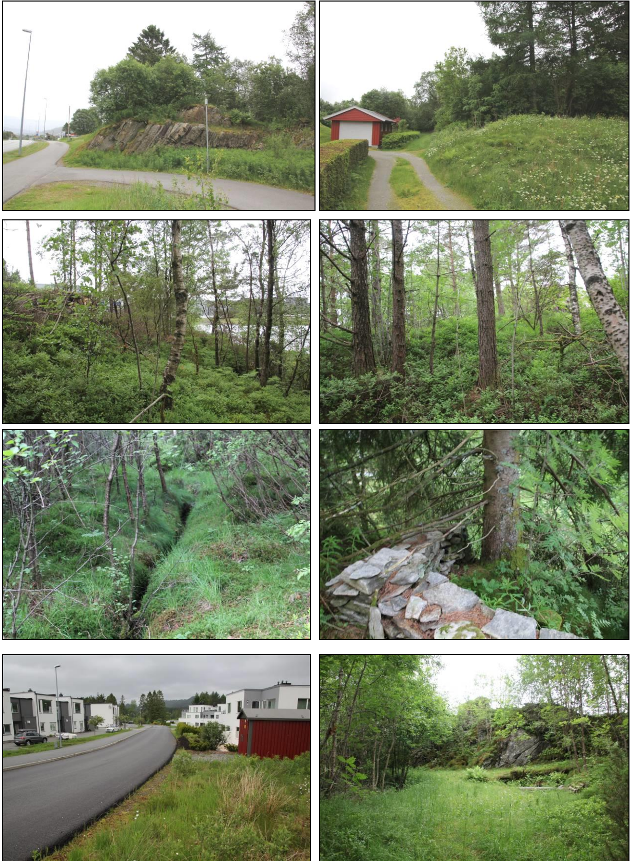
Figur 7: Øverst: Nordlige del av planområdet for del av Mjåtveitmarka. 2. rekke: Blandings-skog sentralt i planområdet. 3. rekke: Gammel drensgrøft (t.v.) og steingjerde (t.h.). Nederst: Tjørnavegen (t.v.) og gammel tilkomstveg under gjengroing (t.h.).