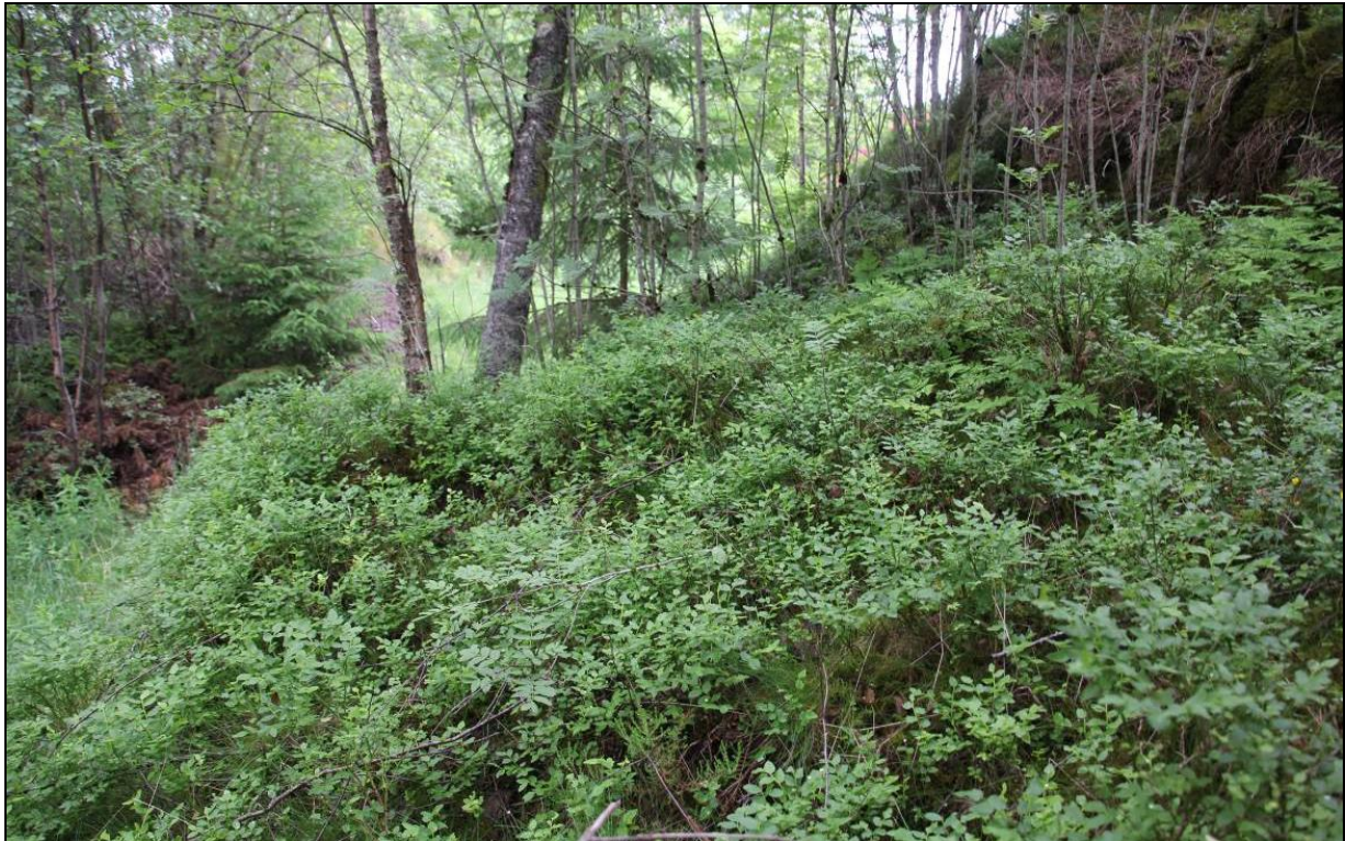
Figur 9: Blåbærskog, med høyt artsmangfold i busk- og tresjiktet, er vanligste vegetasjonstype i del av Mjåtveitmarka.

De lavestliggende delene av planområdet i forlengelsen nordover fra Mjåtveittjørna består av vegetasjonstypen skog-/krattbevokst fattigmyr (K1), med furu og bjørk som hovedarter i tresjiktet (figur 10). I feltsjiktet inngår blåbær, blokkebær, røsslyng, klokkeløve, blåtopp, bjønnskjøgg, torvmyrull, rome, myrhatt, skogsnelle og klokkevintergrønn, mens bunnsjiktet domineres av storbjørnemose ( Polytrichum commune ) og torvmose-arter ( Sphagnum spp. ).