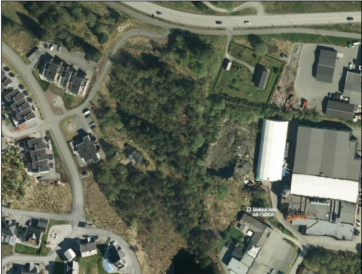
Figur 3: De sentrale delene av planområdet for del av Mjåtveitmarka domineres av blandingskog.