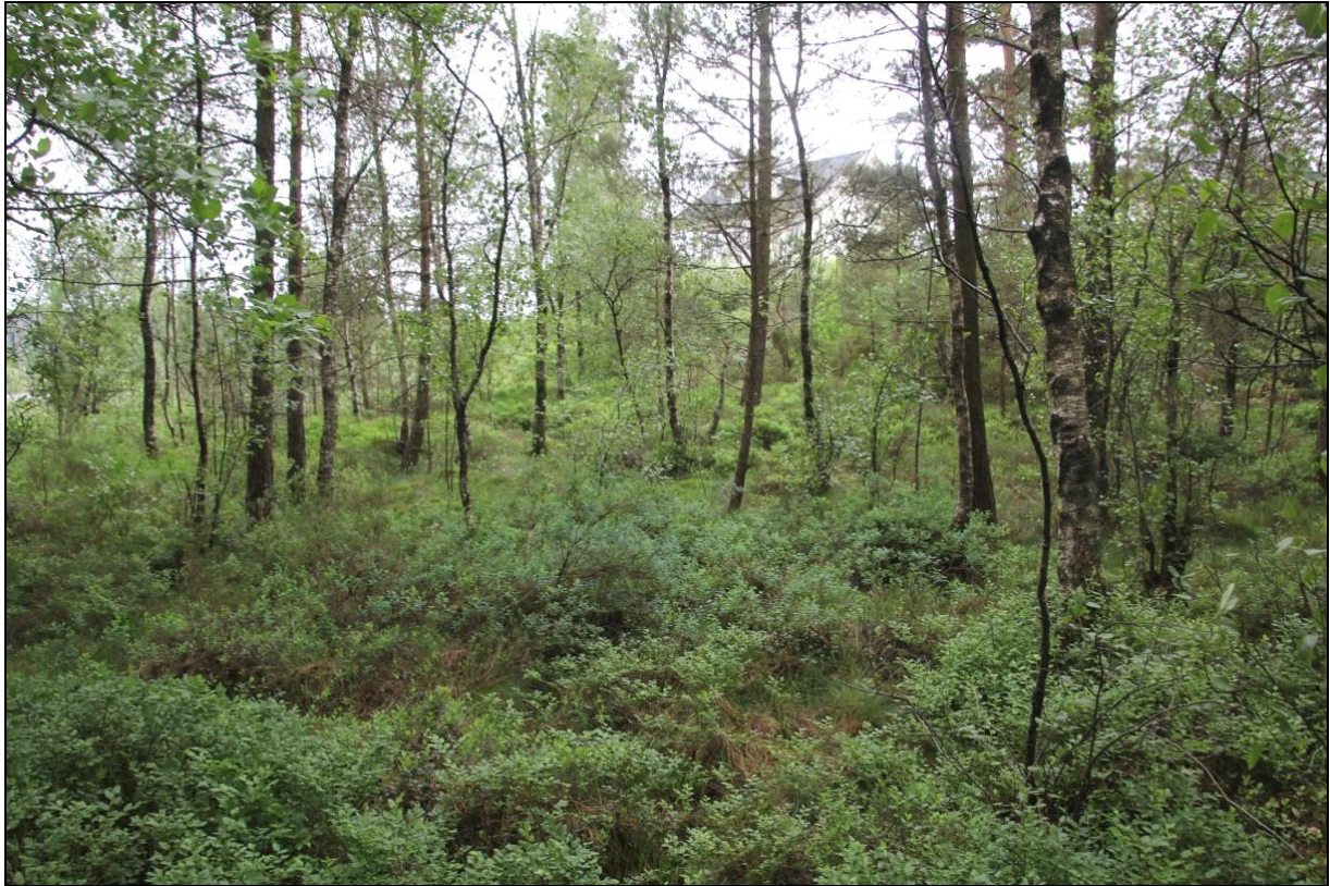
Figur 10: Fuktdråget i forlengelsen nordover fra Mjåtveittjørna består av vegetasjonstypen skog-/krattbevokst fattigmyr (K1).

Planområdet omfatter ellers en del ruderatmark i form av vegkantareal og utfyllinger. Langs gang- og sykkelvegen i nord, og Tjørnavegen i vest, opptrer typiske vegkantarter som: Geitrams, bringebær, engrapp, englodnegras, hundegras, engsoleie, lyssiv, knappsiv, heisiv, myrtistel, løvetann, sølvbunke, engfrytle, krattmjølke, kystbjønnekjeks, skvallerkål, hvitkløver, rødkløver, kystgriseøre, smalkjempe, sløke, småsyre, legeveronika, tiriltunge, kystmaure, gulaks og gråstarr.