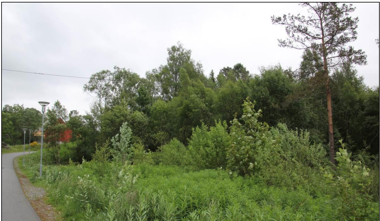
Figur 4: Kratt- og blandingskog ved gangveg nordvest i planområdet.