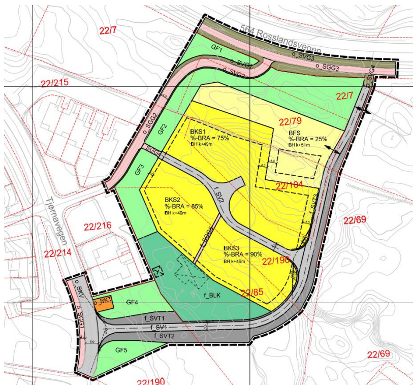
Figur 2: Forslag til plankart for del av Mjåtveitmarka på Frekhaug i Alver kommune.