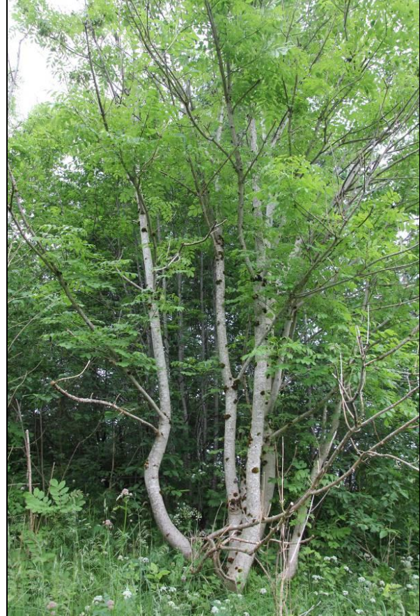
Figur 8: Rødlistearten ask (VU; sårbar) ble registrert i nordøstre del av planområdet for del av Mjåtveitmarka.

Ask (kategori EN; sterkt truet ) er eneste stasjonære rødlisteart 10 som er registrert i planområdet. Det ble observert to middels store individer (figur 8) og et par helt unge individer i nærheten av gammel tilkomstveg nordøst i området. I tillegg ble fiskemåke (kategori VU; sårbar ) observert på hyppige overflukter. Fuglene har trolig fastere tilknytning til et område noe sør-øst for planområdet. For øvrig viser Artskart at gråspurv (NT) er registrert i planområdet, og stær (NT) er registrert på naboeiendom i nord.