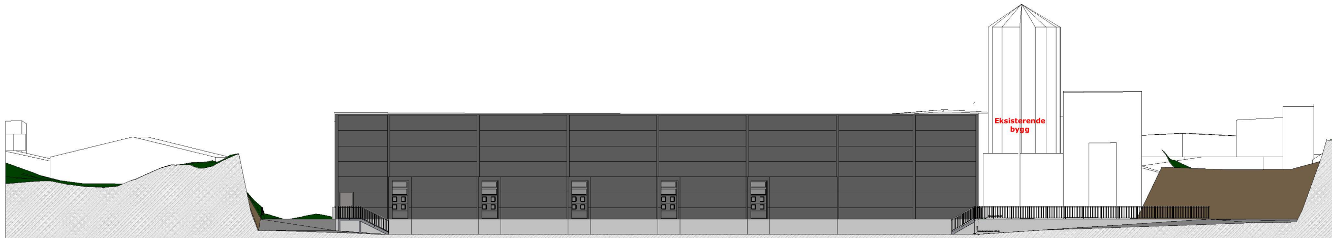
1:300 Fasade Vest