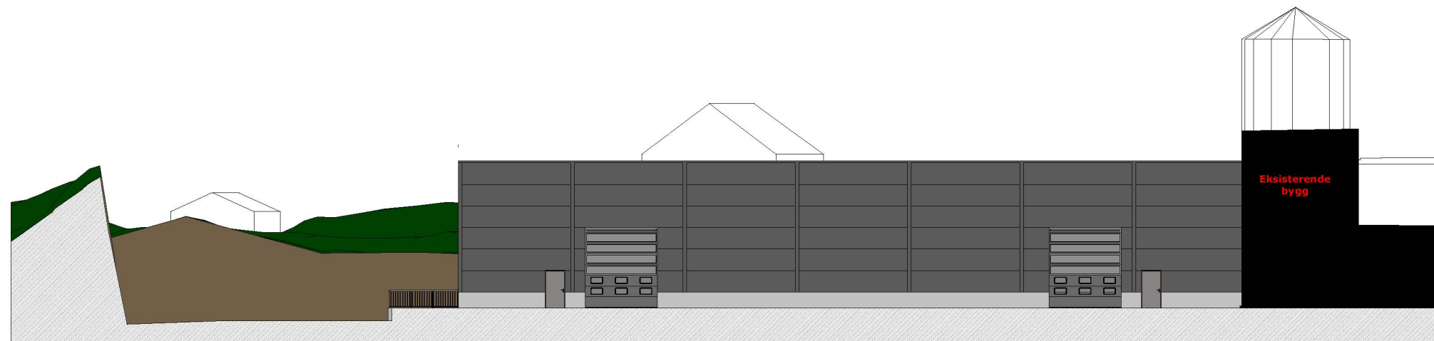
1:300 Fasade Sør