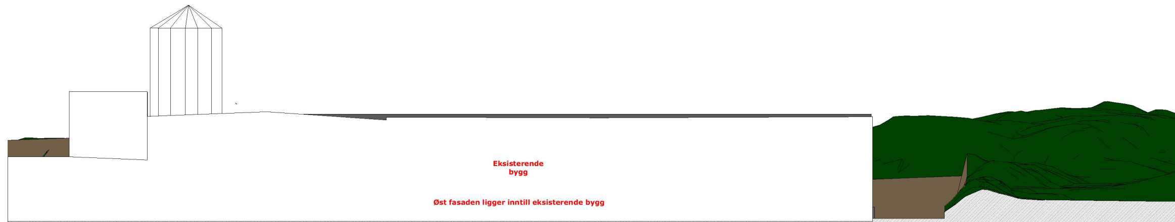
1:300 Fasade Øst

PROSJEKT Mjåtveitflaten 9, Frekhaug Gnr/Bnr: 322/131 og 322/69