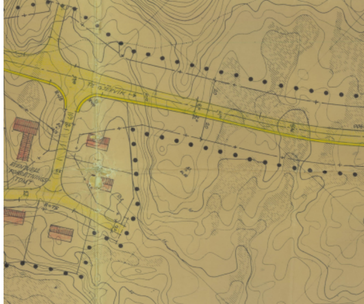
Utsnitt RP Isdal – Gjervik Ytre Blad III

Delar av tiltaket ligg i regulert område innanfor reguleringsplanen for Felt E Såta. Arealføremålet er friområde.