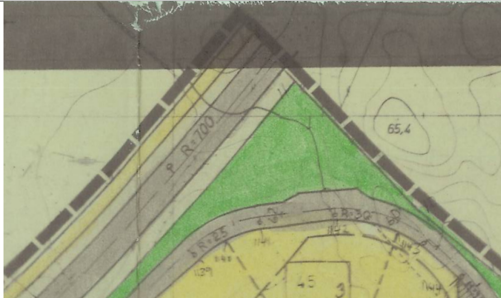
Utsnitt RP for Felt E Såta

Delar av tiltaket ligg i regulert område innanfor reguleringsplanen for Felt E Såta. Arealføremålet er friområde.