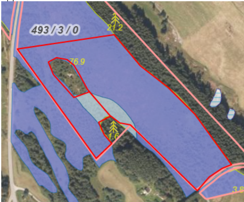
Figur 2 Nydyrkingsområde består av djup myr og noko grunn myr

forbodet. Dersom dispensasjonssøknaden fell inn under eit av dei særlege tilfella nemnt i forskrifta, kan det likevel berre gjevast dispensasjon når behovet for tiltaket er meir tungtvegande enn omsynet til natur- og kulturlandskap om omsynet til klima. Statsforvaltaren held fram at sækjar må dokumentere at nydyrkinga er av vesentleg betydning for å oppretthalde drifta.