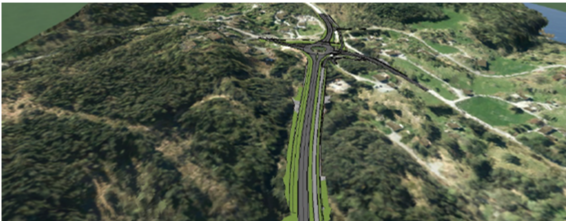
3d-modell av A1 sett frå nord