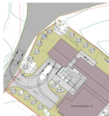
Utsnitt som viser ny avkøyrslé frå privat veg

Ansvarleg søkjar har den 19.04.2023 vore i kontakt med Samferdsel, veg-, vatn- og avløp forvaltning vedkomande avkøyrslé. Vi har gitt tilbakemelding om at vi vil gje ei uttale til byggesak som vil fatte vedtak i saka.