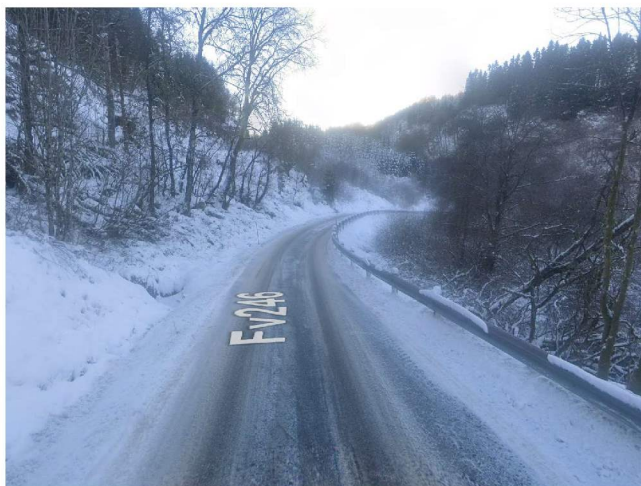
Område for veiutbedring på venstre side av veien, sett fra sør

Selve vegetasjonsryddingen på østsiden av veien medfører ingen graving eller andre inngrep i grunnen. Siden området her er bløtt/myr og delvis innenfor grensen for mulig marin leire, vil arbeidet utføres skånsomt med lettere utstyr.