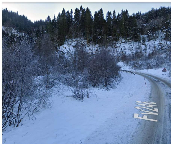
Område for vegetasjonsrydding på venstre side av veien, sett fra nordøst

I og med at området for veiutvidelsen er friskmeldt og at det ved utførelsen av vegetasjonsryddingen vil tas hensyn til grunnforholdene, vil det ikke være nødvendig med ytterligere vurderinger av områdestabiliteten.