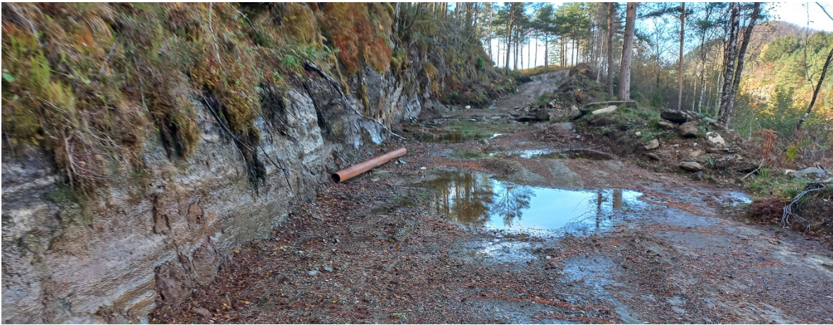
Fig. 6. Veg 1 vert plassert på ei «hylle» i terrenget.