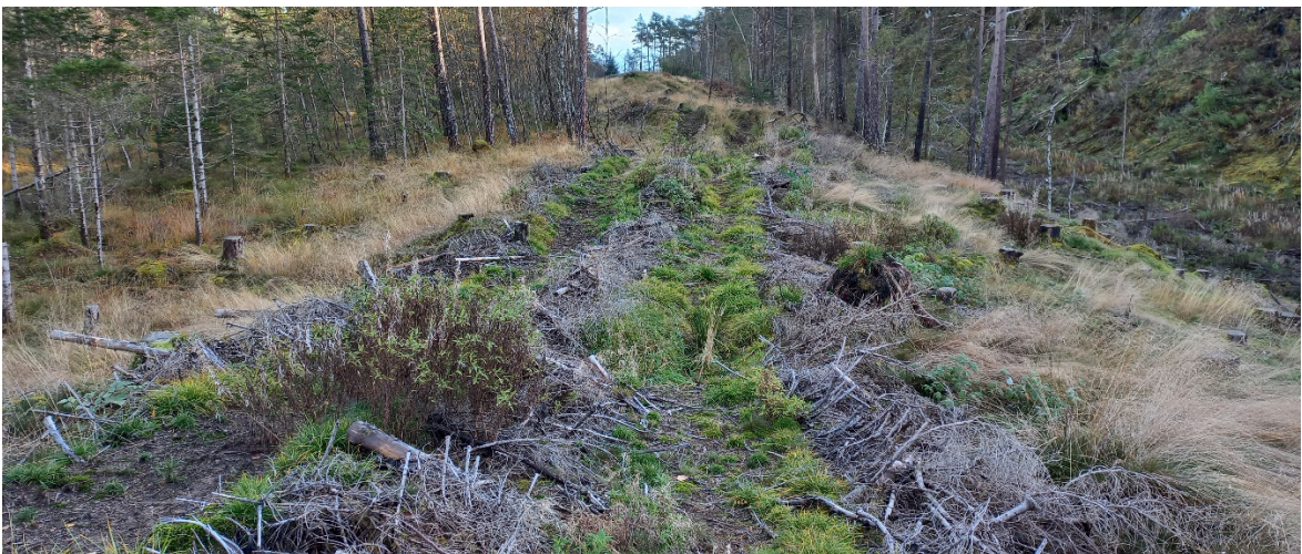
Fig. 7. Veg 2 vert lagt langs med ei myr. Biletet er teke i sørleg retning.