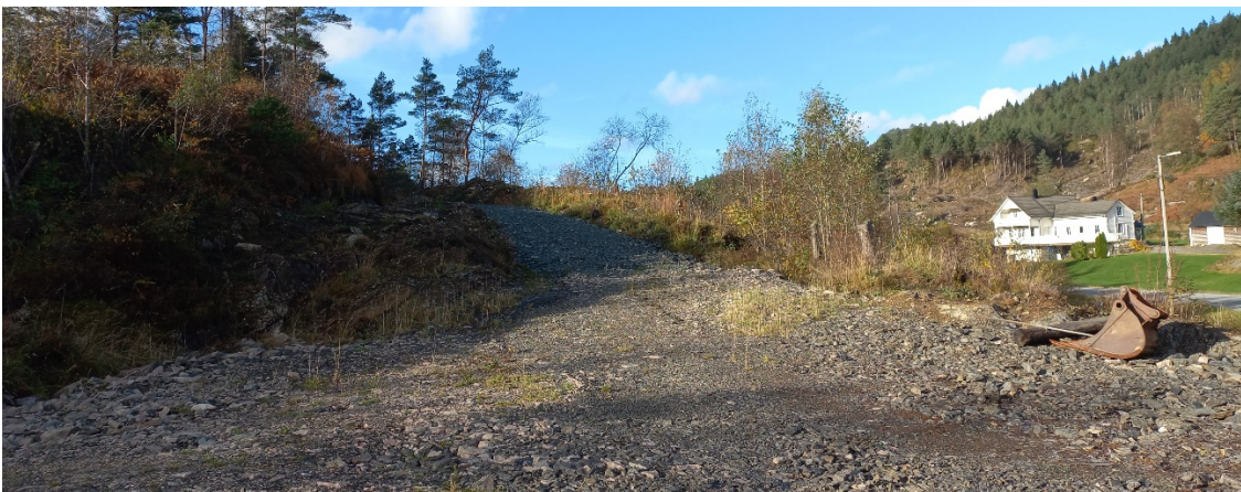
Fig. 4. Området der veg 1 startar.