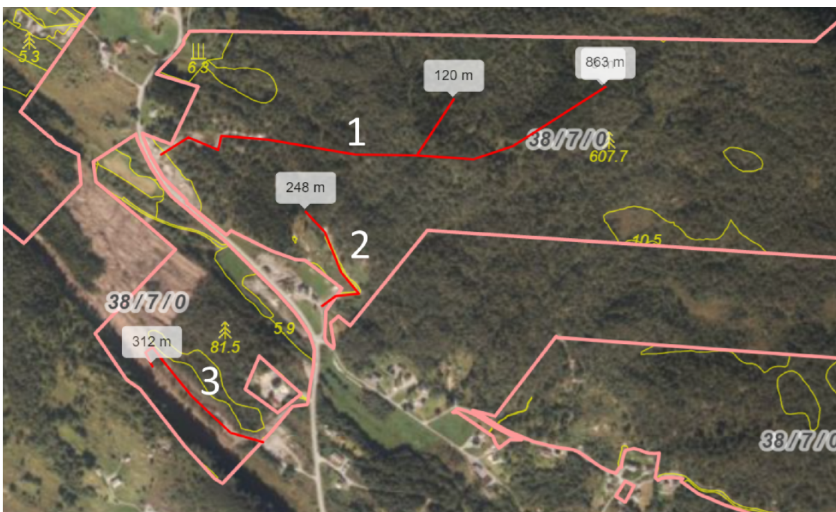
Fig. 2. Trasé for veg 2 er merka «3».