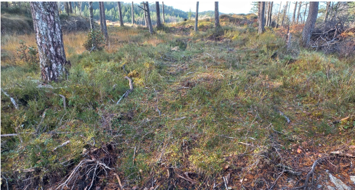
Fig. 6. Lengst nord skal veg 1 svinge vestover og deretter eit kort stykke nordover att.