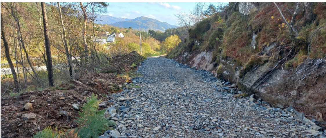
Fig. 5. Veg 1 vidare oppover frå området synt i fig. 4.