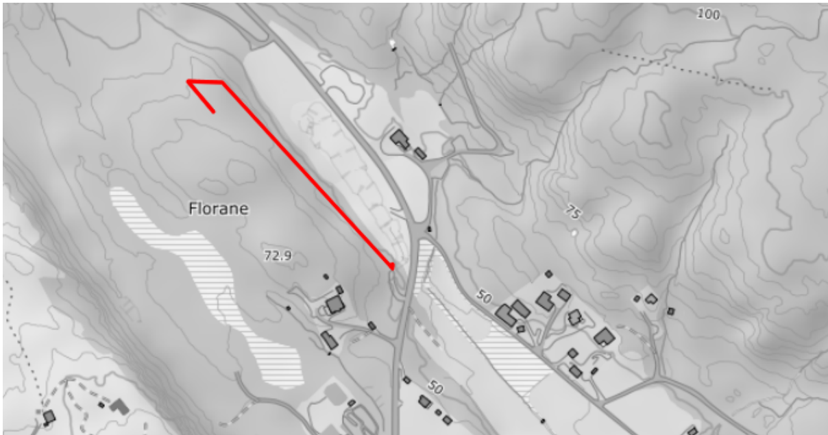
Fig. 1. Trasé for veg 1.

Atle Kleiven søkjer om å få byggje landbruksvegar i vegklasse 2 – heilårsbilveg på gnr. 38, bnr. 7 slik som fig. 1 - 2 nedanfor syner. Vegane vert om lag 540 m og løyser ut 80 daa hogstmoden skog med til saman 1250m 3 . Vegane er kostnadsrekna til kr 650.000,-.