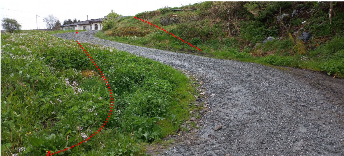
Fig. 2. Frå tunet har eksisterande veg ein del svingar som må utvidast om lag som skissert med stipla liner på biletet. Utforming av detaljar vert gjort under arbeidet.

Vegen startar vest for tunet på gnr. 63, bnr. 1. I dette området må eksisterande veg rettast ut for å kome fram med bilar i høve det som vegklassen er tilpassa – sjå fig. 2 – 3 nedanfor. Vidare skal vegen gå over innmark slik fig. 4 - 5 neste side syner.