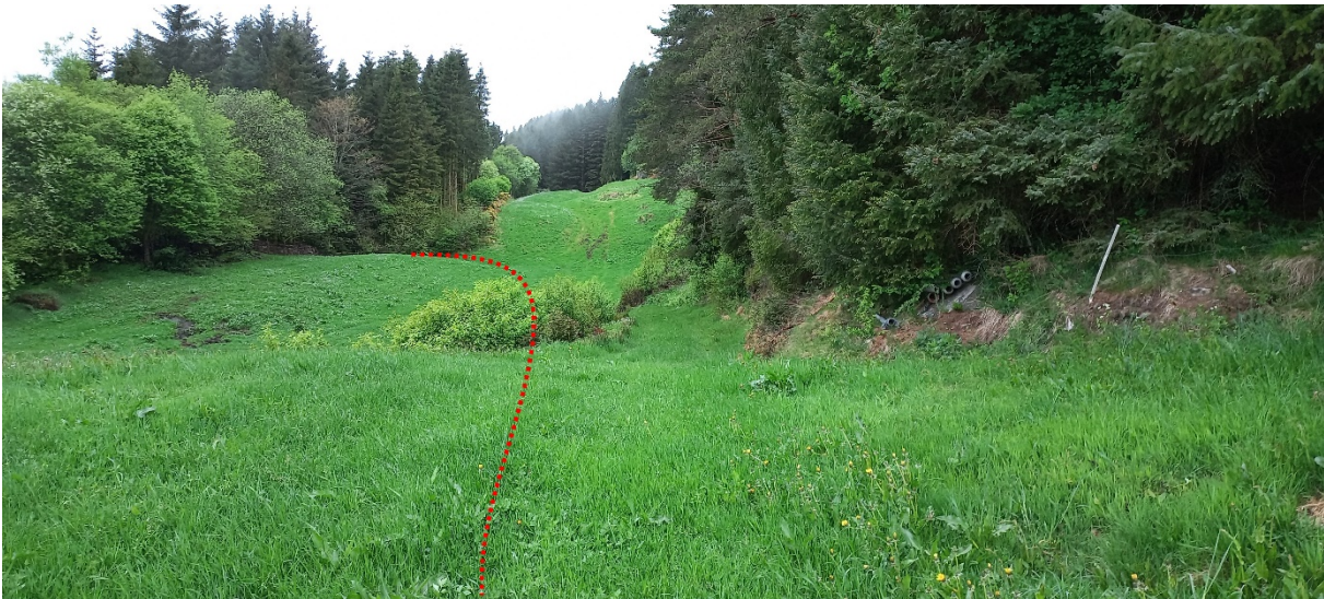
Fig. 5. Til slutt så vil vegen halde fram frå der den vert «retta ut» i fig. 4 og vidare bortover bøen før den svingar ned til venstre i skogen. I skogen er det ein del enkle vegar. I bakkant av innmarka ser vi at det står meir skog austover.

Lenger aust på eigedomen står det i dag mykje skog der mykje av den er hogstmoden. Denne skogen strekkjer seg òg vidare austover på nabobruk. Utan å ha vurdert det særskilt, kan det verte aktuelt å kople nabobruk (Gnr. 59, bnr. 1 og 3) til denne vegen i framtida. Men det kan òg vere aktuelt å kome austanfrå via desse bruka til delar av skogen på dette bruket. På bakgrunn av dette vert det sett som vilkår for løyvet at nabobruk skal ha høve til å kunne kjøpe seg inn i vegen om det er turvande for å ta ut skog på deira bruk.