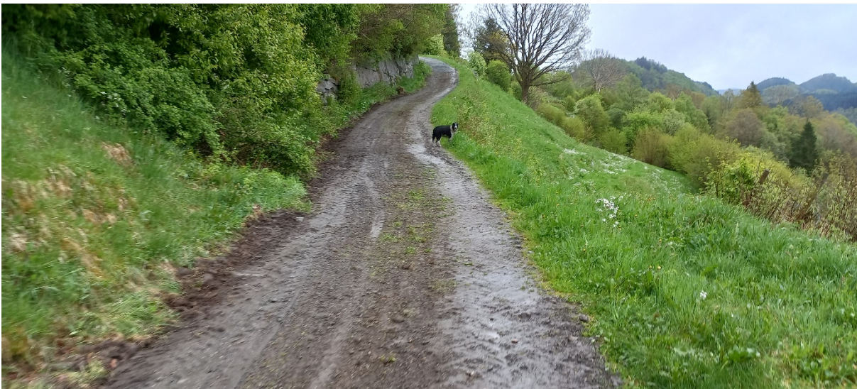
Fig. 3. Nedanfor svingen i fig. 2, må breidda utvidast og ein lyt sikre seg at kantane er sterk nok til å bere tyngda av bilar vegklassa opnar for.