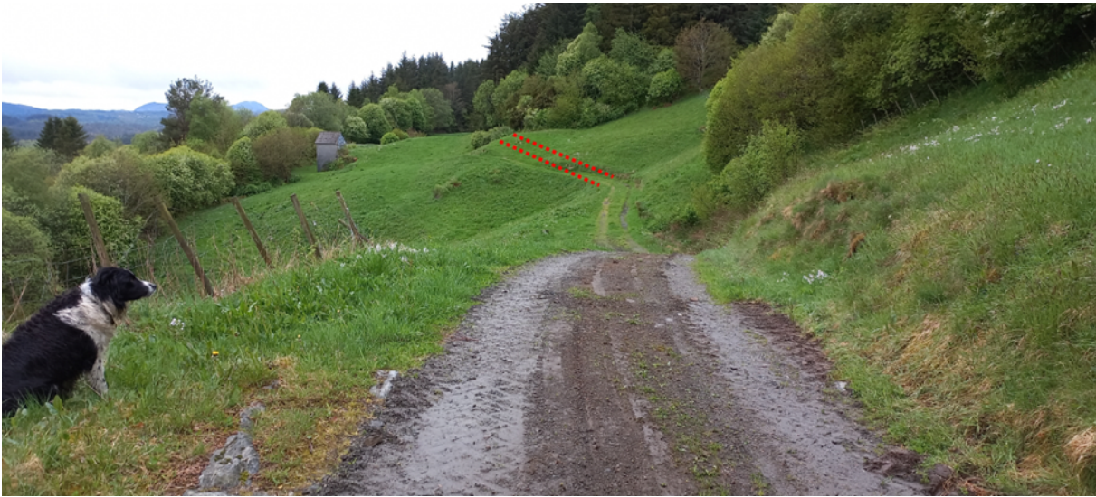
Fig. 4. Vidar austover vil vegen etter vart gå over brattlendt dyrka/overflatedyrka jord. Eit kortare stykke skal lina til eksisterande veg rettast ut, elles fylgjer den traséen til denne.