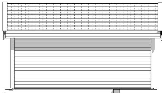
1:100 Fasade Vest