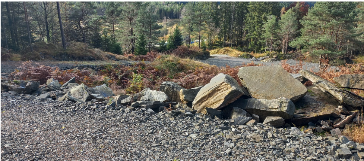
Fig. 2. Vegen er bygd i nedre del. Vi skimtar fv. 5464 lengst borte midt i biletet.

Statsforvaltaren har ikkje gjeve attendemelding innan fristen.