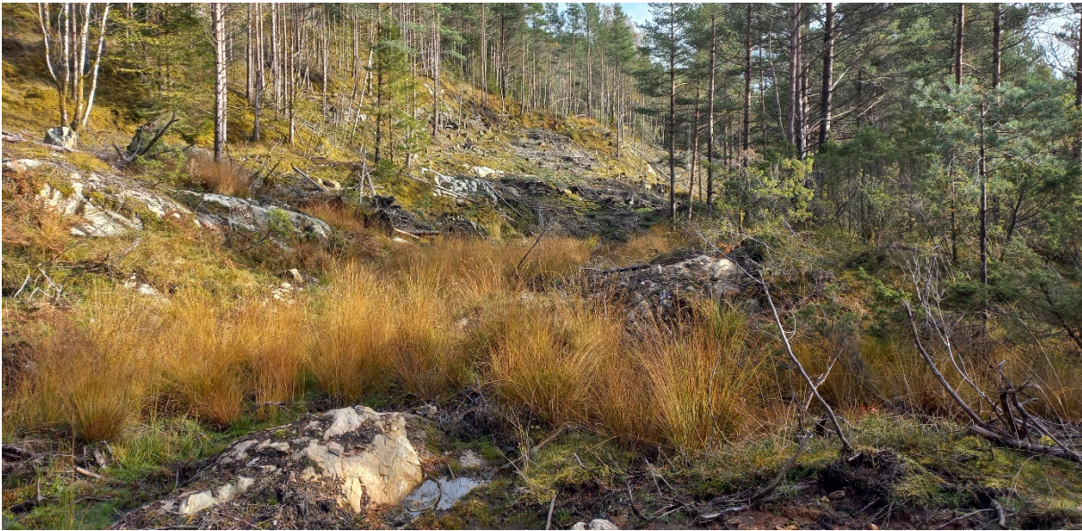
Fig. 4. Vidare oppover skal vegen leggjast på avsatsen om lag midt i biletet og halde fram vidare oppover gjennom eit område med blandingsskog.

Det skal takast ut masse på gnr. 38, bnr. 16 i området synt på fig. 5 nedanfor.