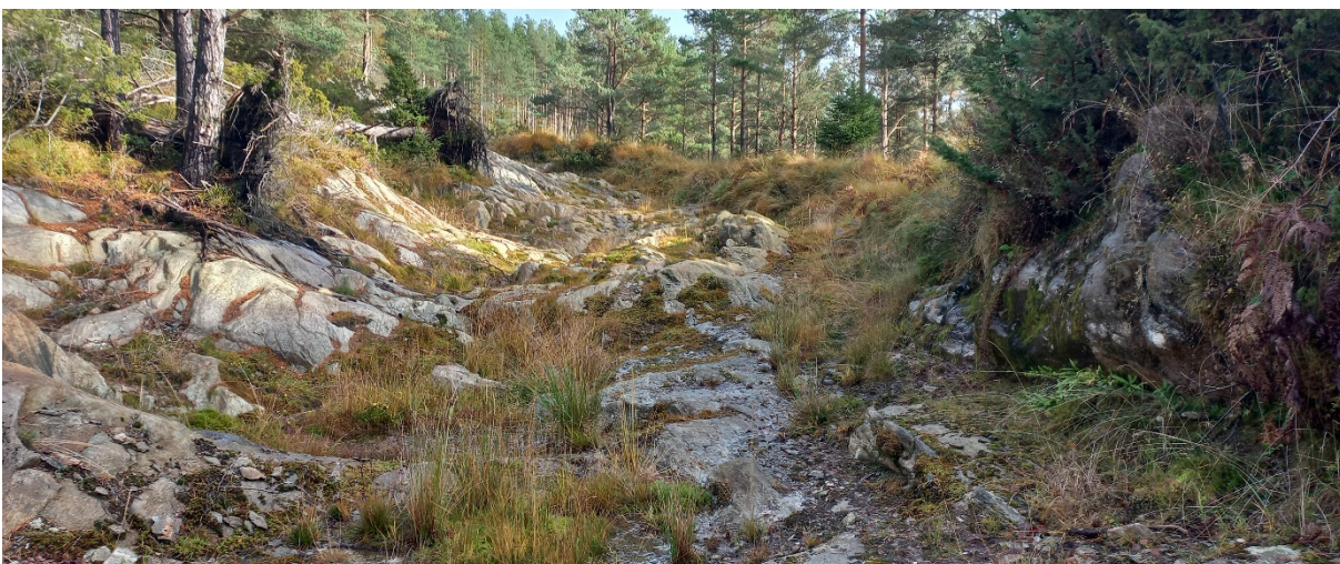
Fig. 3. Oppover frå området synt i fig. 2, er traséen skote ut eit stykke vidare.