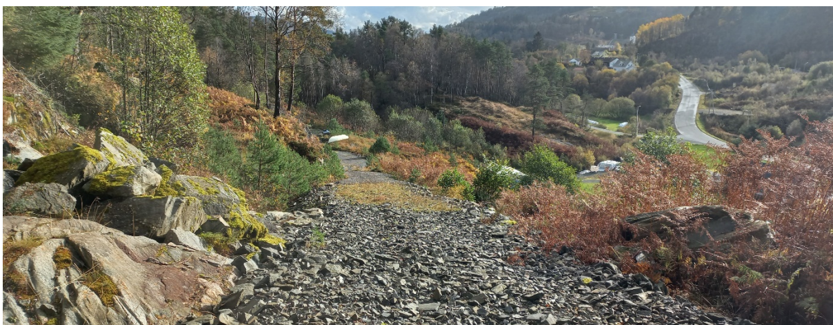
Fig. 2. Store delar av vegen er bygd. Vi ser fv. 5464 lengst borte til høgre. Ned til høgre ligg bnr. 16 der vegen startar frå.

Statsforvaltaren har ikkje gjeve attendemelding innan fristen.