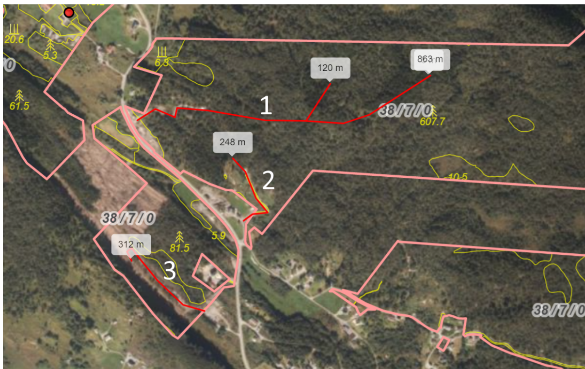
Fig. 1. Vegen det er tale om her, er merka «2» i figuren over.

Atle Kleiven søker om å få byggje landbruksveg i vegklasse 2 – heilårsbilveg på gnr. 38, bnr. 7 slik som fig. 1 nedanfor syner. Vegen vert om lag 250m og løyser ut 43 daa hogstmoden skog med til saman 395m 3 . Vegen er kostnadsrekna til kr 300.000,-. Det skal etablerast eit massetak (3000m 3 ).