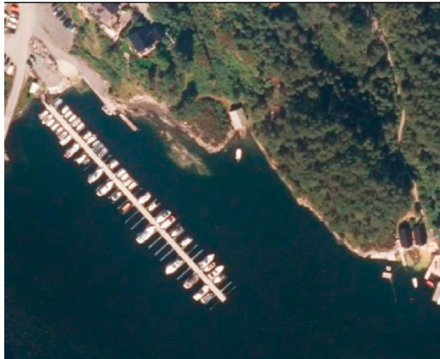
Ortofoto - oversikt