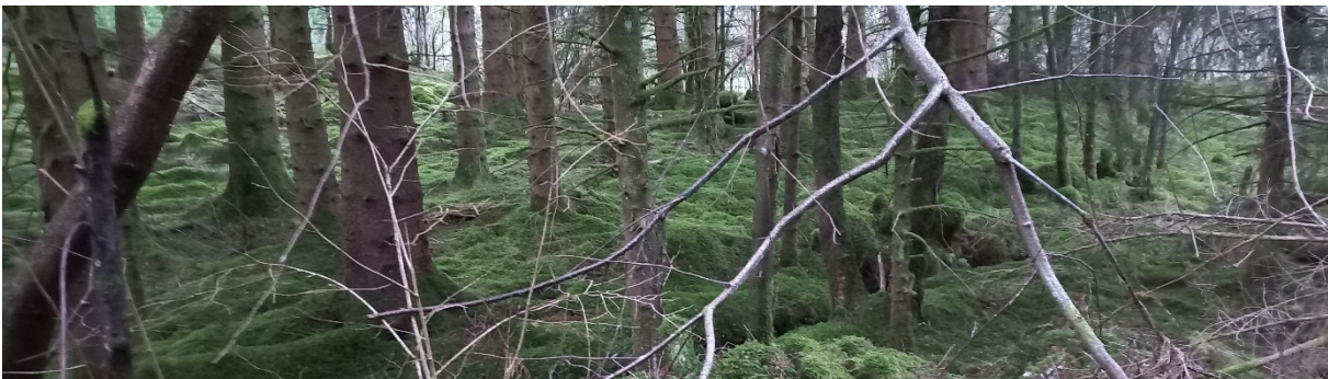
Fig. 6. I dette flate partiet og til høgre skal det lagast ein snuplass (bnr. 2).