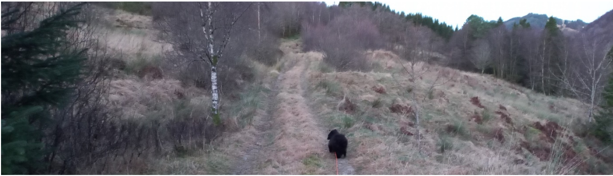
Fig. 3. Lenger nord går traséen inn i gammalt beiteland.