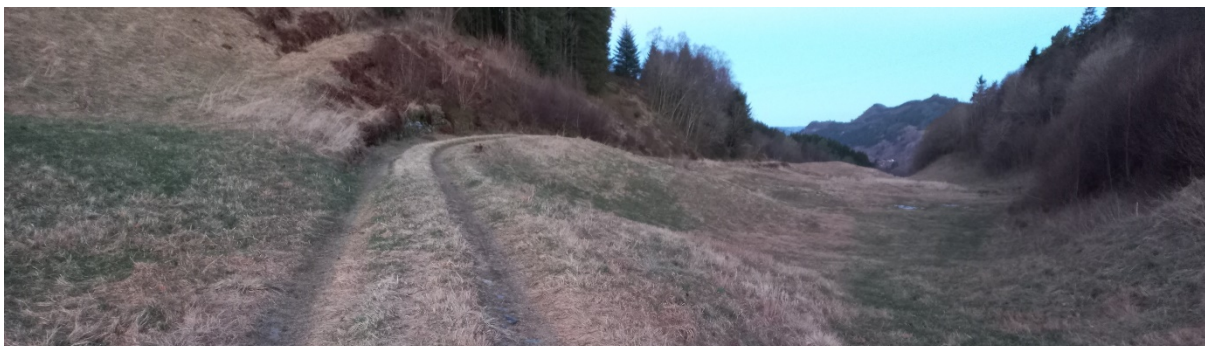
Fig. 2. Vegen startar frå tunet og går nordover på innmark.