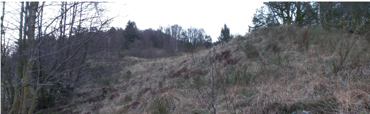
Fig. 4. Sidevegen merka gult i fig. 1 skal leggjast oppover i søkket i terrenget til høgre for straumstolpen.