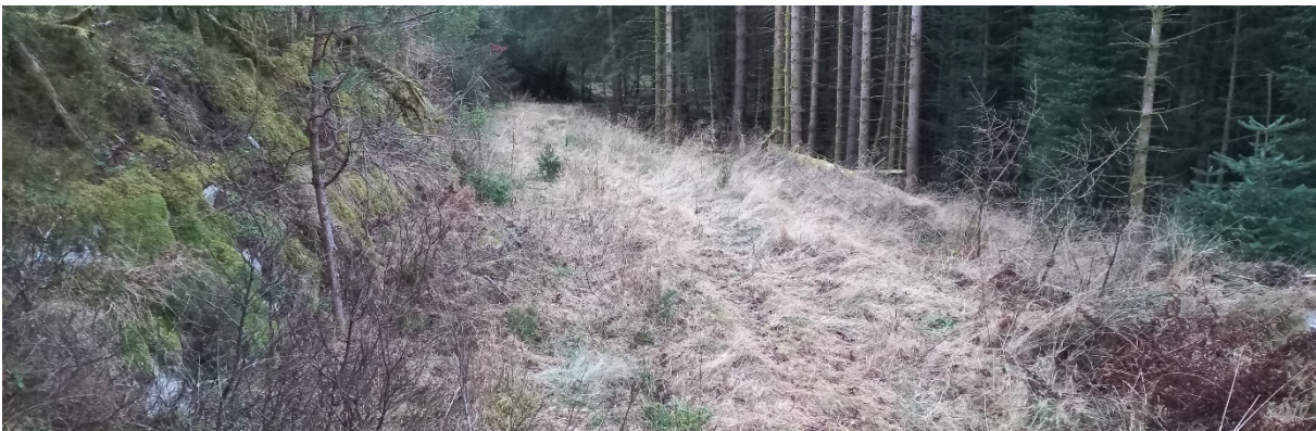
Fig. 5. Veggen held fram innover i skogen (her på bnr. 2).