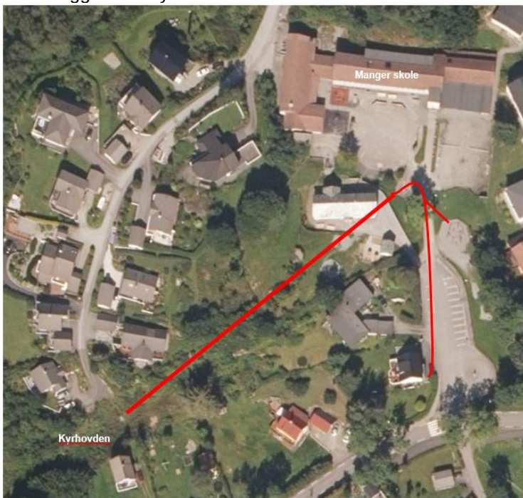
Figur 1 Oversiktskart over traseen.

Ny kommunal overvannsledning etableres fra Manger skole, og sørvest mot det nye kommunale VA-anlegget ved Kyrhovden.