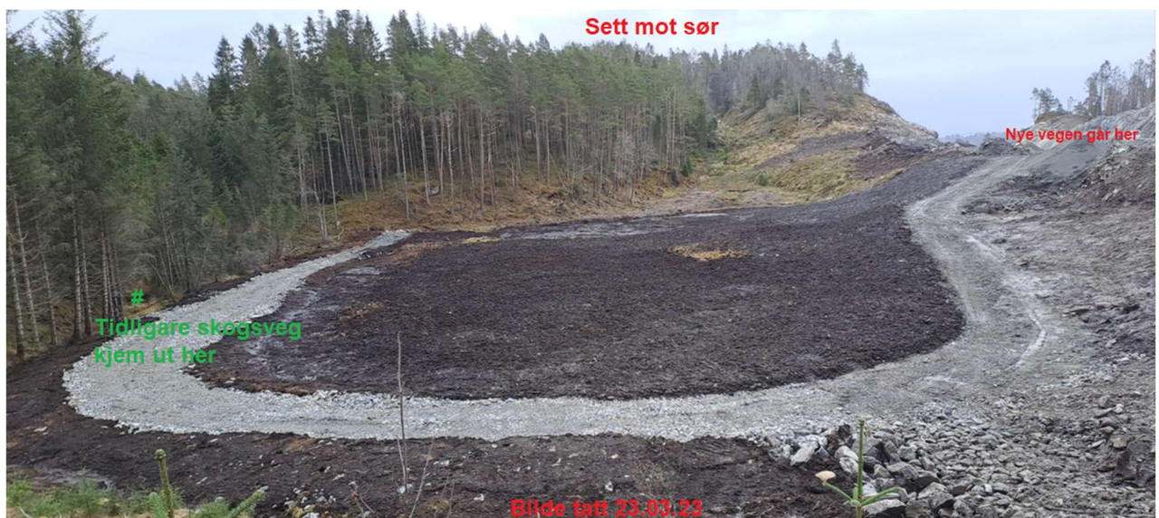
Bilde 5 Her ser ein mot sør, over deponiet og inn på teigen 496/27. Teigane blir avskjært i vest av nyevegen.

tlf.984 33 009 epost: mariaspletten@gmail.com