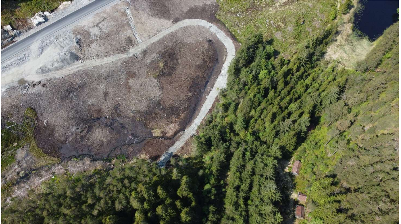
Bilde 6 Torvhusa ser ein i nedre høyre hjørne, nye veggen ser ein oppe i venstre hjørne, massedeponi midt i bilde.