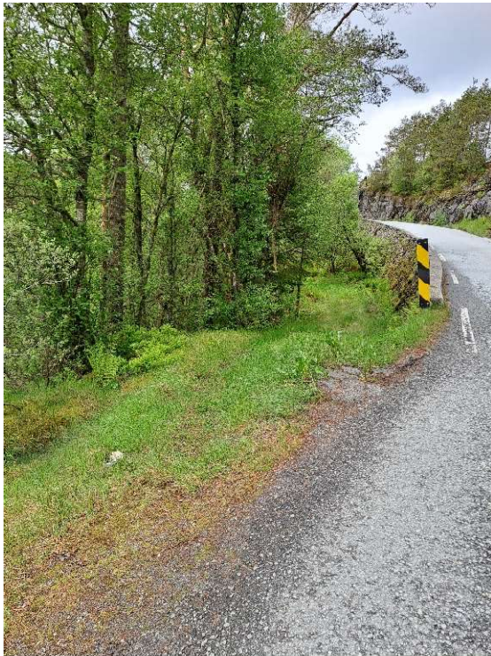
Bilde 2 avkjørsle traktorveg frå gamle FV565