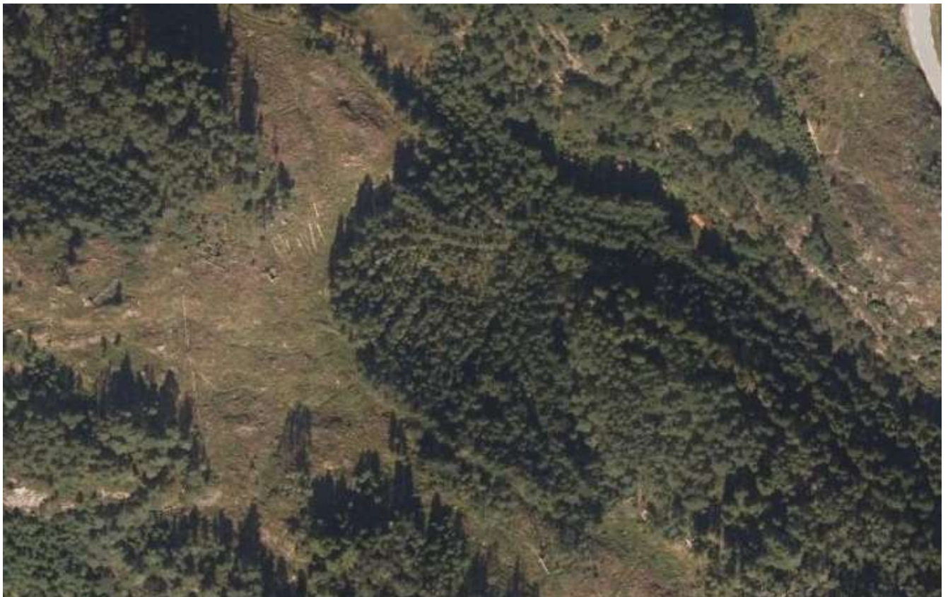
Bilde 1 over Flyfoto av Såtemyra FØR vegarbeidet begynte.

I forbindelse utbygginga av ny fylkesveg 565 Marås-Soltveit er deler av arealet på 496/1 midlertidig erverva til massedeponi. Når grunnerverv blei gjennomført blei det gjort avtale om at «arealet skulle tilbakeførast til opprinnelig stand». Før utbygginga starta ( bilde 1 ) var dette deler av «Torvhusmyrane/Såtemyre», eit område der det frå gammalt av blei henta ut torv. Etter det blei slutt på torvhenting, vart det planta skog då areala ikkje var egna til anna fordi det var ekstremt bløtt (torv blei henta ut, arealet blei fylt med regnvatn og arealet stod under utløpsnivå). I 2015 blei skogen hogd i området, men i Såtemyre blei skogen ståande igjen då det var for bløtt for hogstmaskiner. Skogen i Såtemyre blei hogd av entreprenør når arbeidet med «nye FV565» starta i 2021.