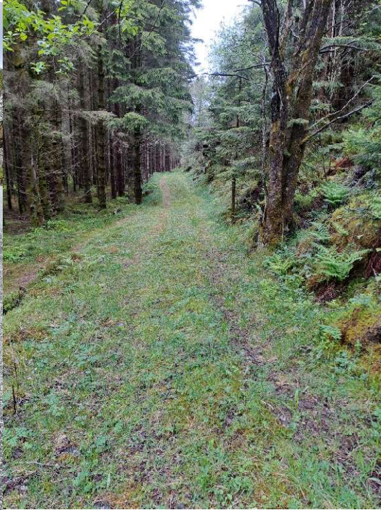
Bilde 3 Traktorveg før ein kjem til Torvhusa