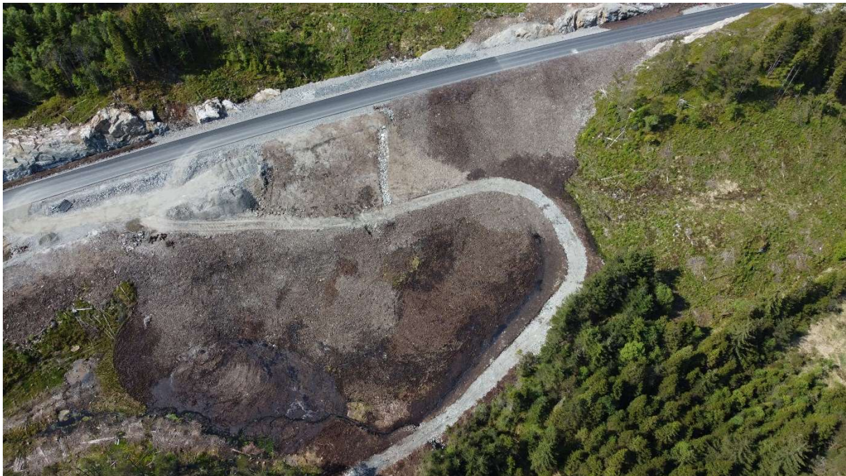
Bilde 7 Nye veggen og massedeponiet