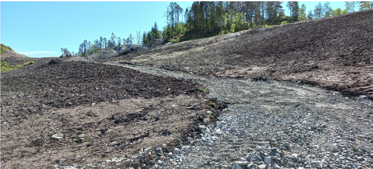
Fig. 6. Som fig. 4, men motsett veg. Den nye vegen ligg øvst i kanten i biletet.

Vi torer be om uttale innan 3 veker dvs 04.07.2023.