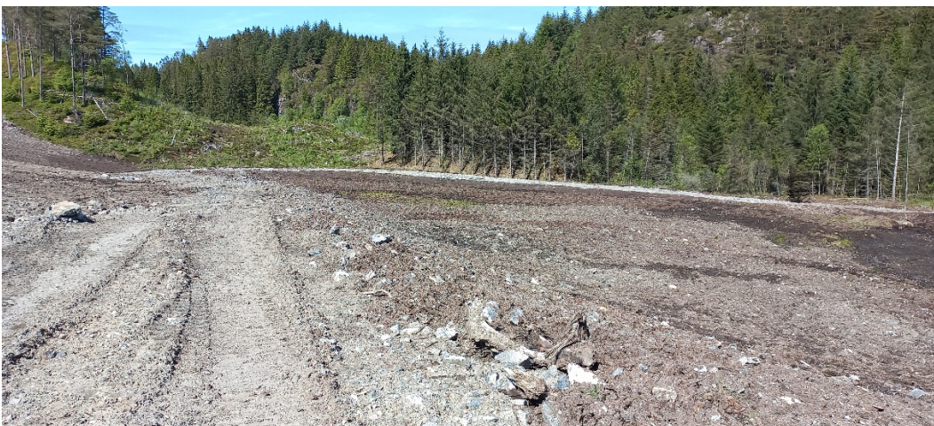
Fig. 4. Deponiområdet med veg per 02.06.2023.