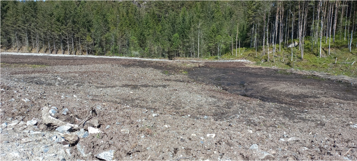
Fig. 5. Som fig. 4.