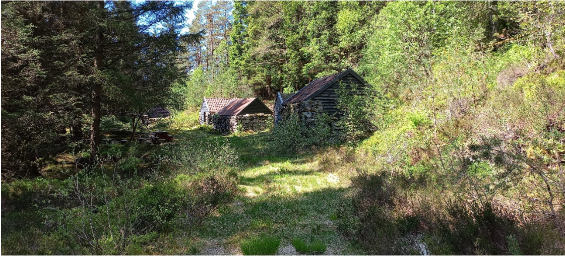
Fig. 2 og 3. Torvhusmiljø.