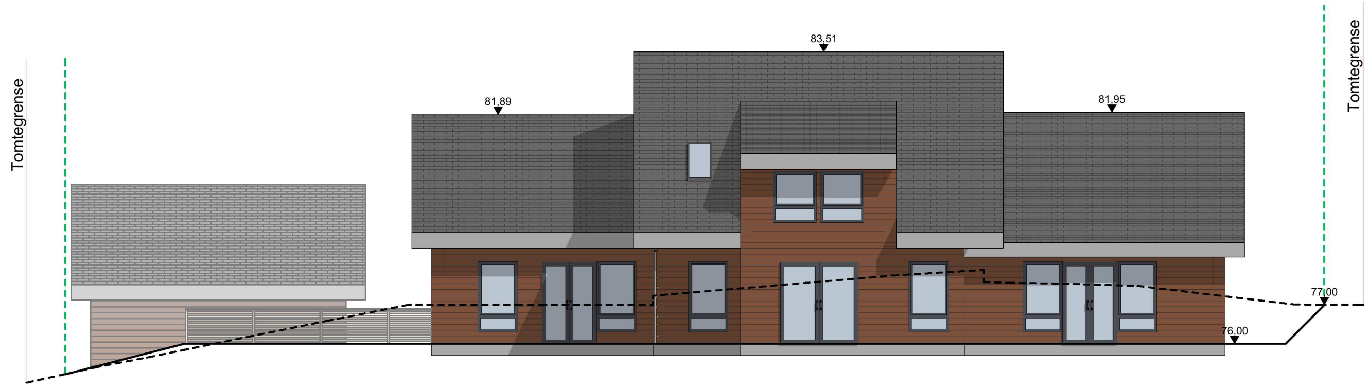
1:100 Fasade Øst