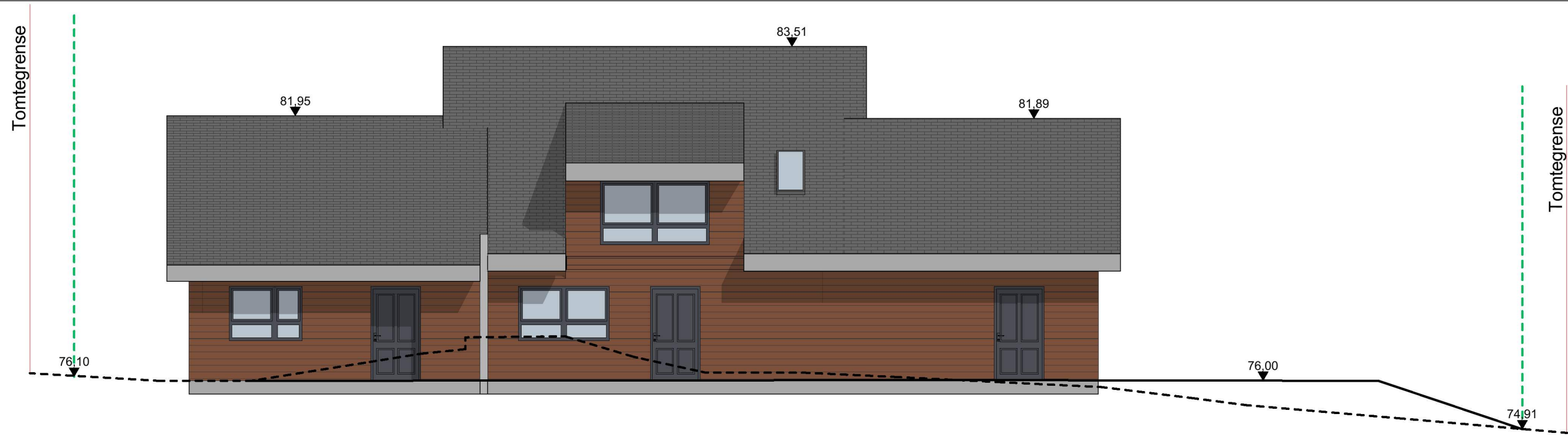
1:100 Fasade Vest