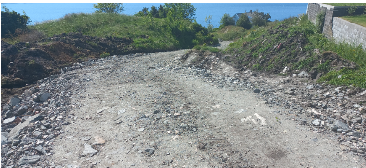
Fig. 2. Rett vest for tunet gå vegen vestover mot grensa til naboegedomen. Tunet ligg bak fotografen og ein veg skal gå vestover gjennom tunet til gamal innmark.