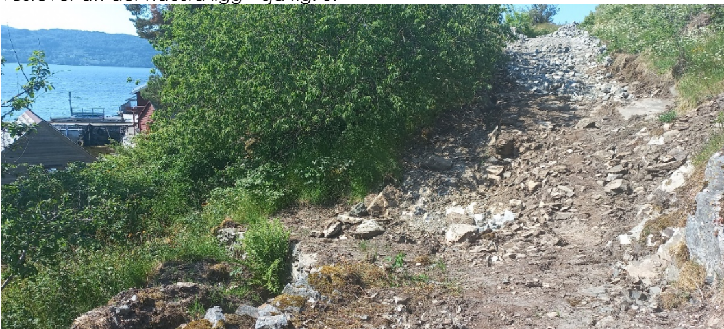
Fig. 5. Vegen skal halde fram om lag 10-15m mot nausta. Delar av bergnakken om lag midt i biletet, må fjernast.