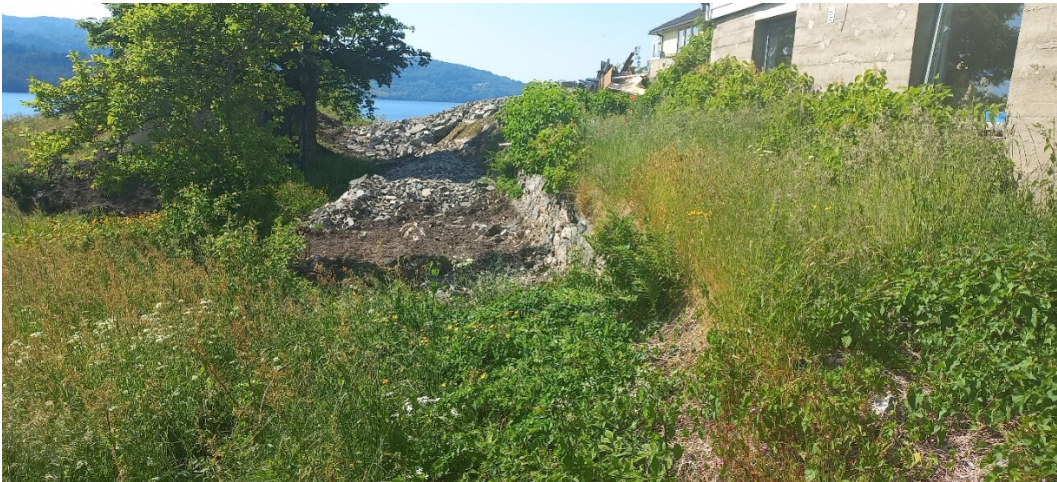
Fig. 6. Nett nedanfor tunet skal vegen gå eit stykke bortover den gamle innmarka til ei område som er tenkt heva – sjå fig. 7.