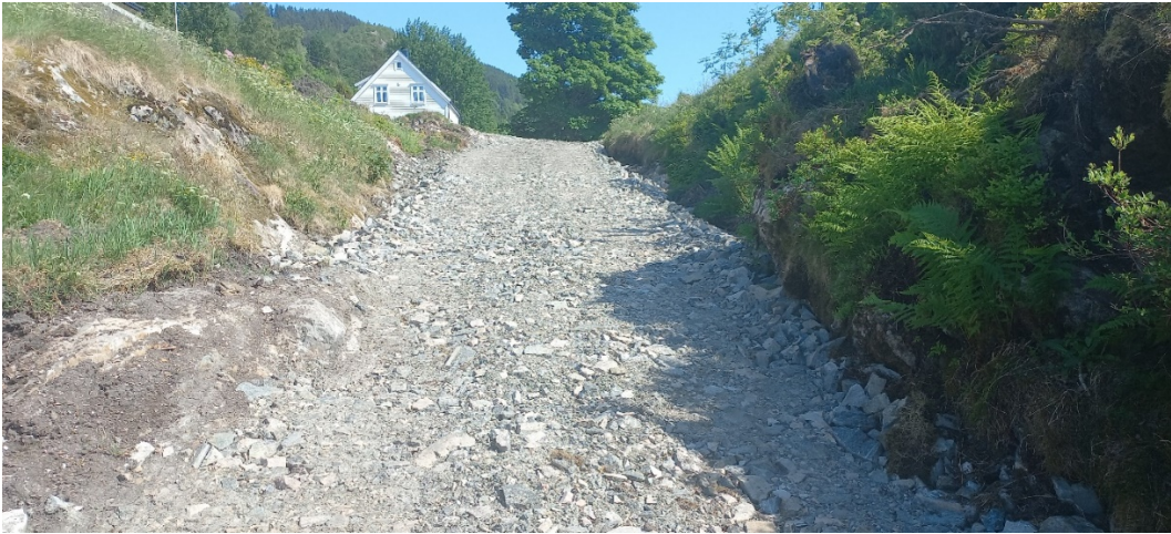
Fig. 3. Vegen sett opp mot tunet der fig. 2 vart teke.