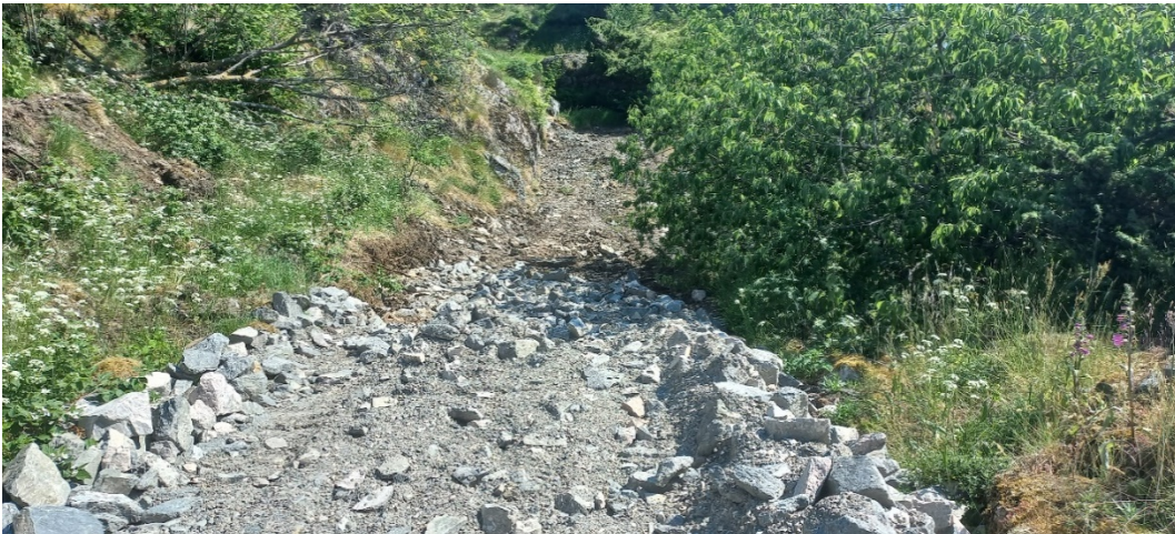
Fig. 4. Etter at vegen svingar søraust att, held den fram ned forbi kirsebærtreet for så å svinge vestover att der nausta ligg – sjå fig. 5.