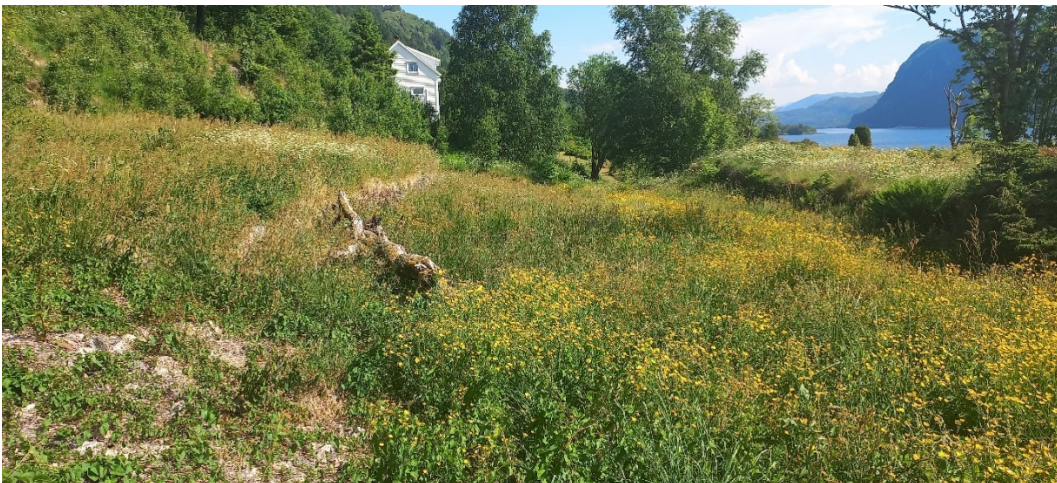
Fig. 7. Vegen skal ende om lag der fotografen står. Planen er å heve arealet i «søkket» til litt lågare enn toppen på kanten til høgre i biletet. Nivået på hevinga til venstre vil gå frå toppen av kanten der.