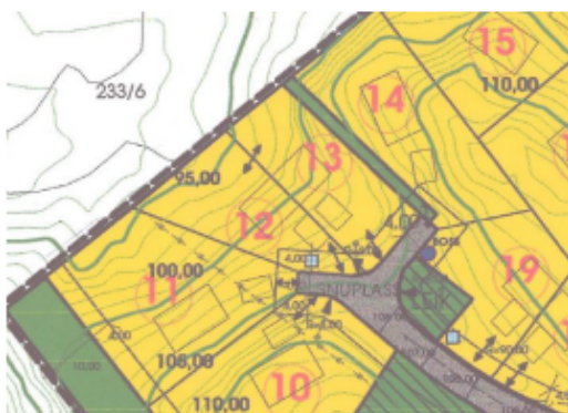
Tomt 12 har en smal 3-kantform som gir liten plass til enebolig.

De 2 tomtene (gnr. 233, bnr. 161 og 162) er forholdsvis smale tomter. For å kunne sikre best mulig utnyttelse av tomtene har vi prosjektert en tomannsbolig. På den måten unngår vi å legge 2 eneboliger med 8 meters avstand på en allerede meget smal tomt. Det blir da mulig å få til et mer hensiktsmessig og egnet uteoppholdsareal. Antall enheter i plan vil ikke endres ved på å erstatte 2 eneboliger med en tomannsbolig.