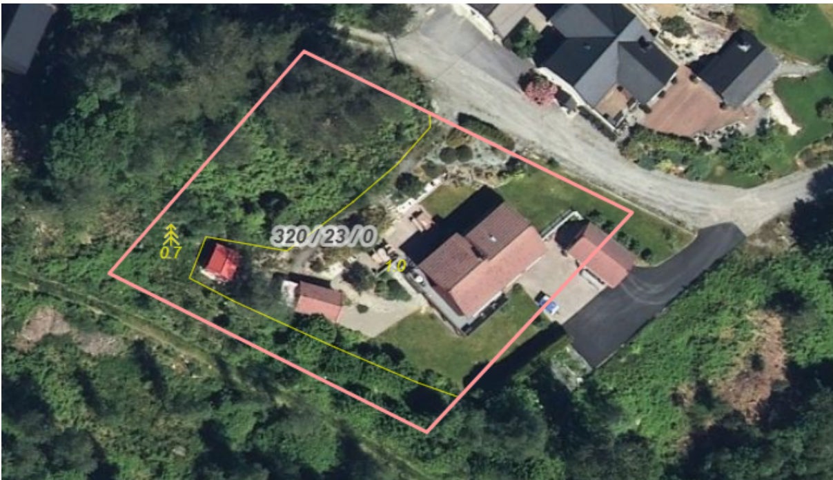
Fig. 2. under. Vi ser at delar av innkøyrsla til bnr. 23 i dag ligg på bnr. 2.

Fig. 1. til venstre. Situasjonsplan vedlagt søknad.