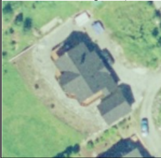
Utsnitt frå orthofoto 2003 gbnr 108/226