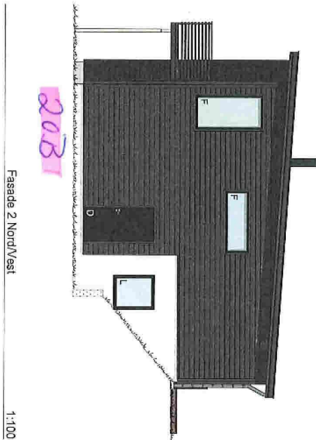
Fasade 2 Nord/Vest