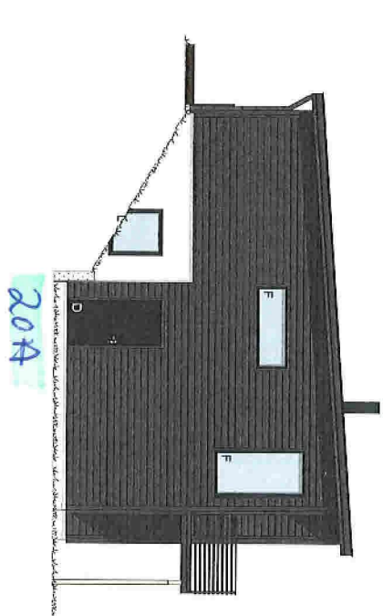
1:100 Facade 4 Sør/Øst

LT vindu må holde formel iht. tek 17§ 13-7. Ag = 0,07 · ABRA / LT (Kontrollert med LT = 0,7)