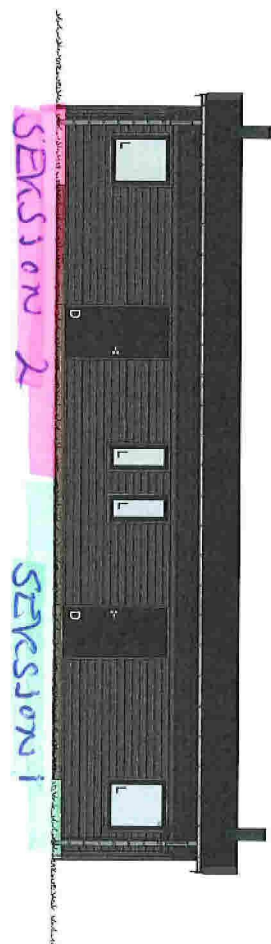
1:100 Facade 3 Sør/Vest