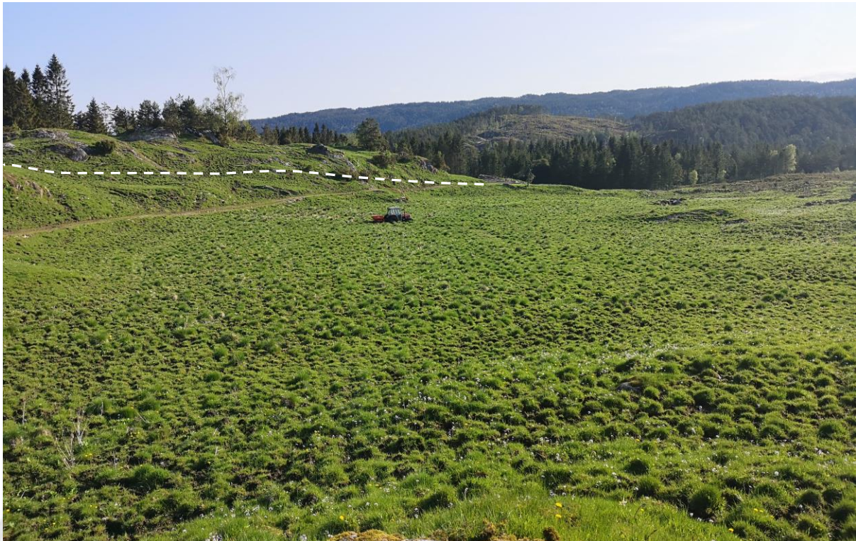
Bilde 1. Tiltaksområdet fra sør. Avgrensning mot nord antydnet med hvit stipla linje.

Jordtippen vil anlegges med vei rundt hele feltet, samt vei langs midten av feltet. Disse veiene vil være nødvendige i anleggsperioden for å få plassert massene, men vil også beholdes som driftsveier for senere jordbruksdrift. Veien i midten kan dekket med et tynt lag jord, og vil da fremstå som kun to hjulspor. Driftsveien langs sørsiden vil også kunne gi tilkomst til skogområder på gnr. 210/2