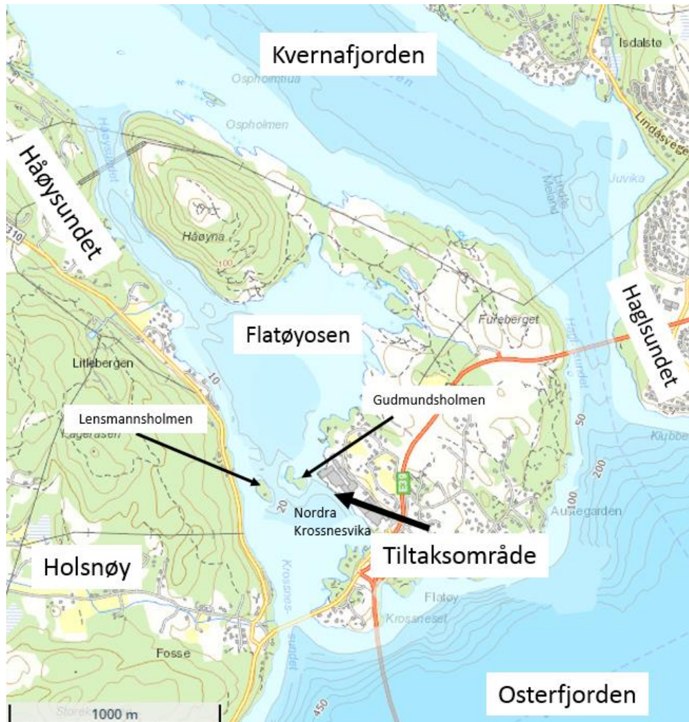
Figur 1: Oversiktskart over Flatøy. Relevante stedsnavn er uthøvet.

for de tre sundene Lensmannssundet vest, Lensmanssundet øst og Gudmundssundet reduseres fra 1690 m 2 til 1340 m 2 . Denne reduksjonen tilsvarer en reduksjon i areal på omkring 21%. I det kommende vil de tre smale sundene mellom Nordre Krossnesvika og Flatøyosen omtales som en eller flere terskler for enkelhetsskyld.