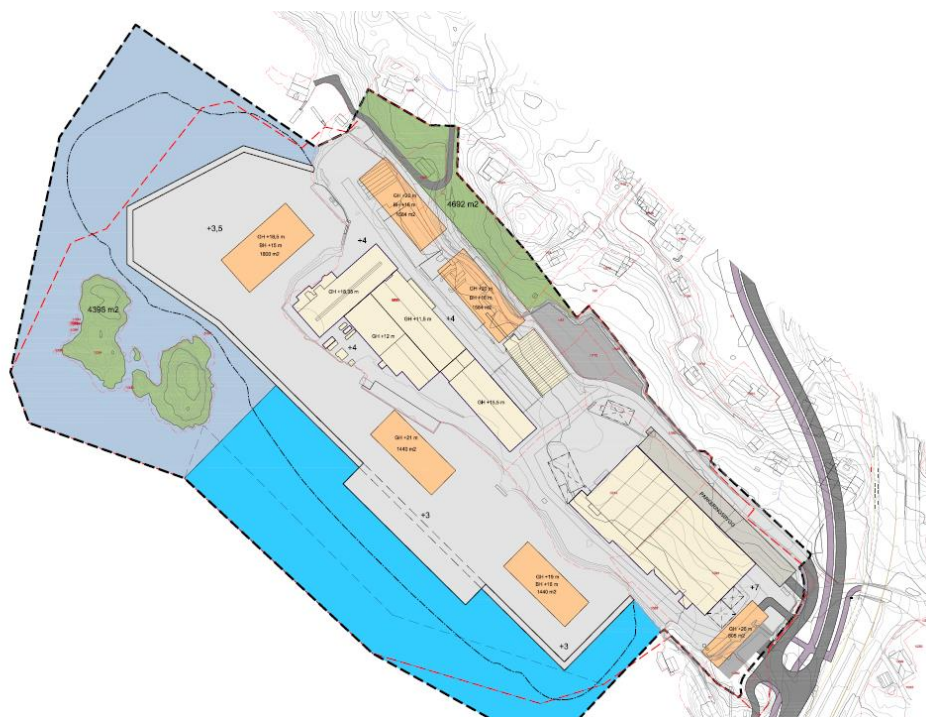
Figur 2: Planskisse som viser utvidelse av landareal og tilhørende fylling i sjø. Blått området sør for Gudmundsholmen viser ferdelsområde i sjø tilknyttet planlagt kaiområde.