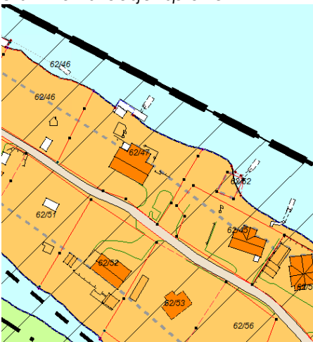
Utsnitt av kommunedelplan