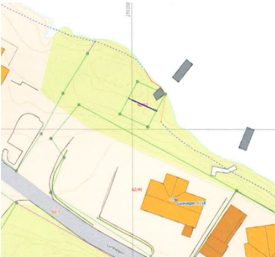
Utsnitt av situasjonsplanen