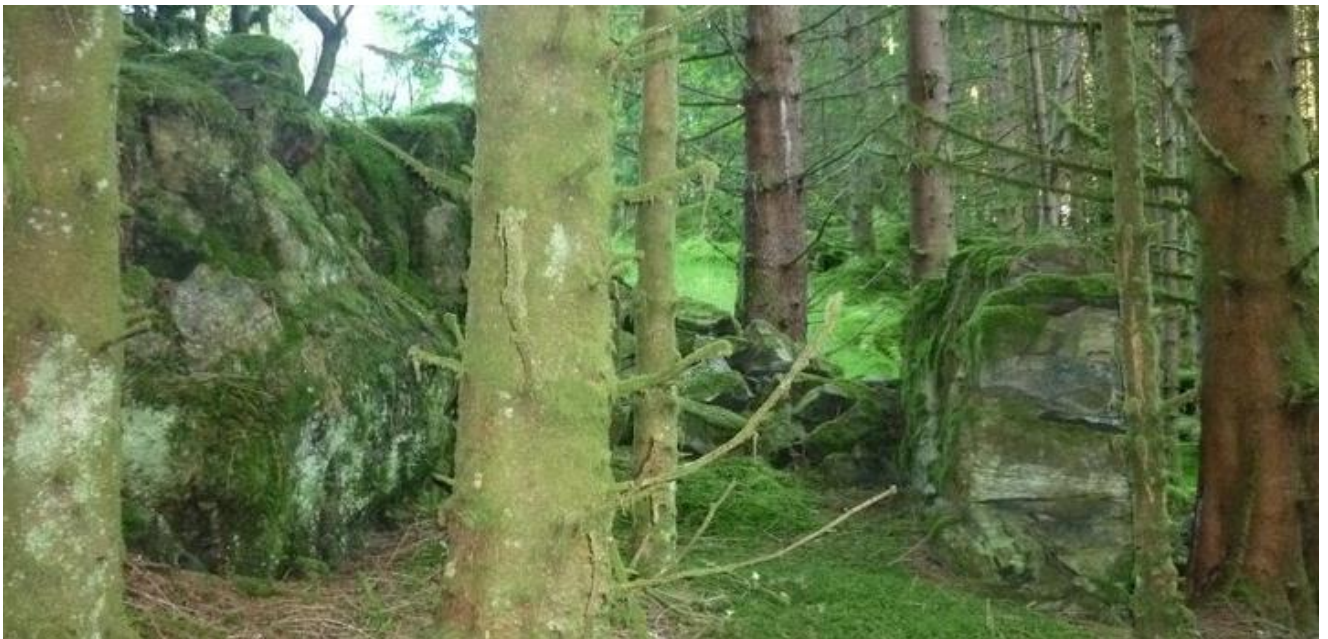
TORVHUS: Torv var ei viktig energikjelde på garden Sellevoll fram til 1947. I Veneset står det restar etter dei gamle torvhusa i utmarka.