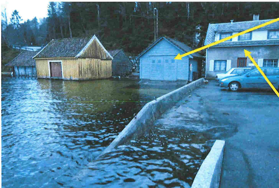
Det gamle nøstet ble flyttet hit på 202/8 Det ble revet i 1990 og bygd opp igjen. Godkjent av Lindås kommune. Viser til vedlegg 4

Med unntak av bolighuset på 202/8 er det ingen som har faste parkeringsplasser på den utfylte «fjæra». Vi har i alle år parkert her de få gangene vi er i nøstet.