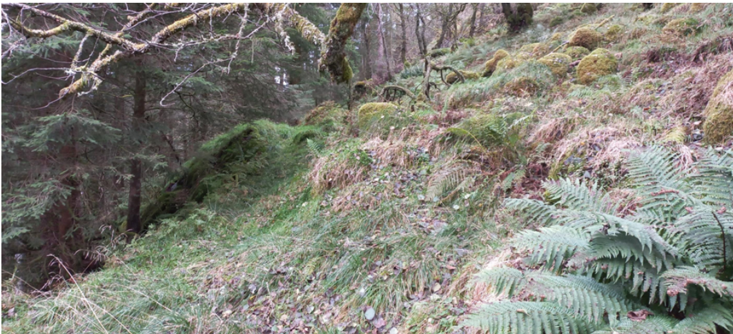
Fig. 4. Inne på bnr. 4, er det eit kortare parti der den naturlege «hylla» er borte.