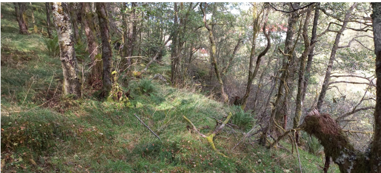
Fig. 2. Vegen tek som nemnt til i tunet på bnr. 5 som vi skimtar i bakgrunnen.