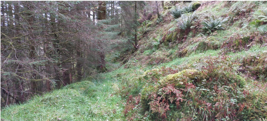
Fig. 3. Lengst nord (på bnr. 5) er det mykje lauvskog. Lenger sør, etter kvart som vi nærmar oss grensa til bnr. 4, er det ein del gran med dels grove dimensjonar. Også her er det mykje innslag av lauvskog. Vegen skal framleis liggje på «hylla» i det dels bratte terrenget.