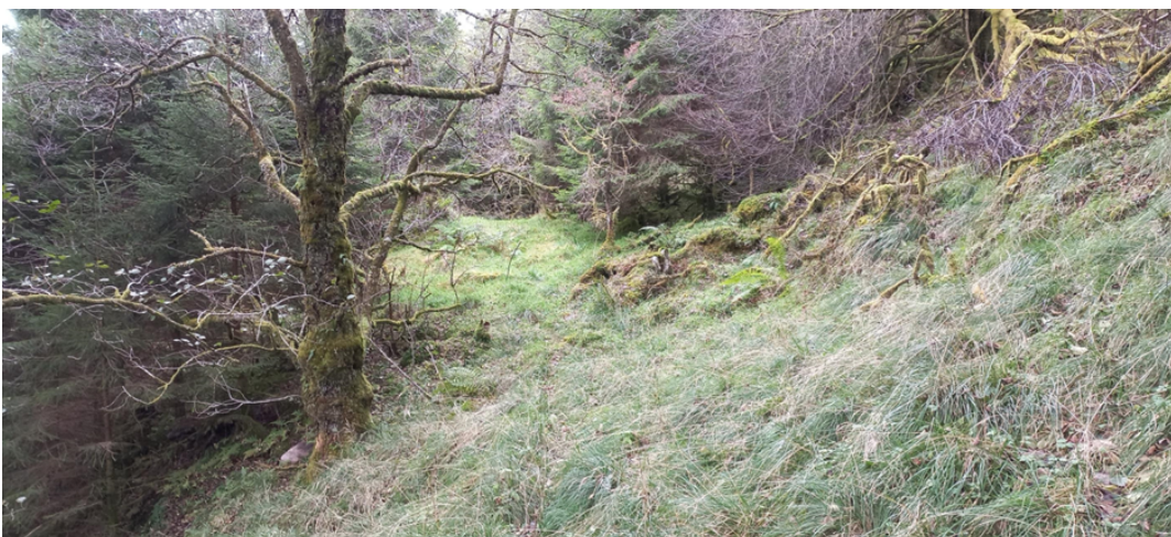
Fig. 5. Heilt sør på bnr. 4 og i grensa mot gnr. 201, bnr. 1 Sætre, skal det byggjast ein snuplass på det flate partiet vi finn her.