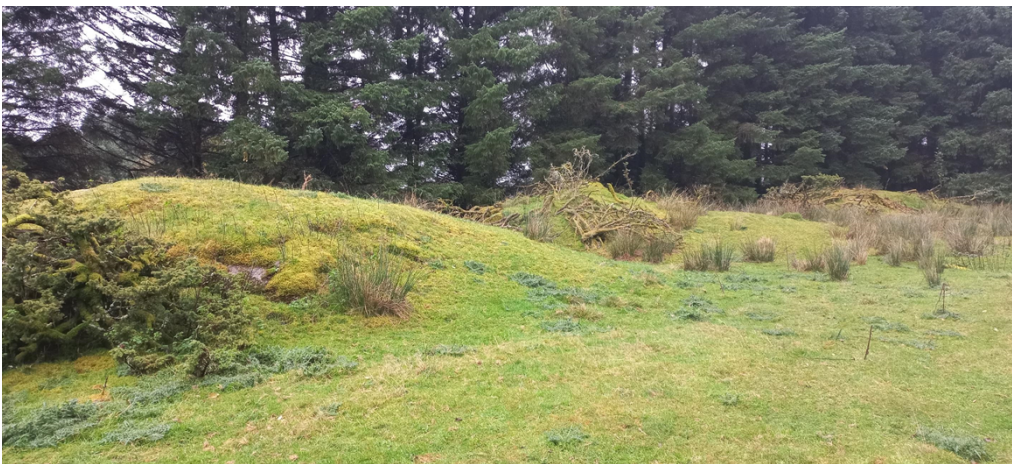
Fig. 4. Mot grensa til gnr. 433, bnr. 4 er det i dag tre fjellhaugar. Planen er å nytte massane frå desse til å byggje vegen. I grensa mellom dei to gardsbruka står det nokre rekkjer med gran. Bak haugane går det ein steingard i grensa mellom dei to gardsbruka. Det er ein opning i steingarden bak den midtre haugen, og traséen er tenkt lagt gjennom steingarden der slik at minst mogleg av denne vert øydelagt – sjå fig. 5.