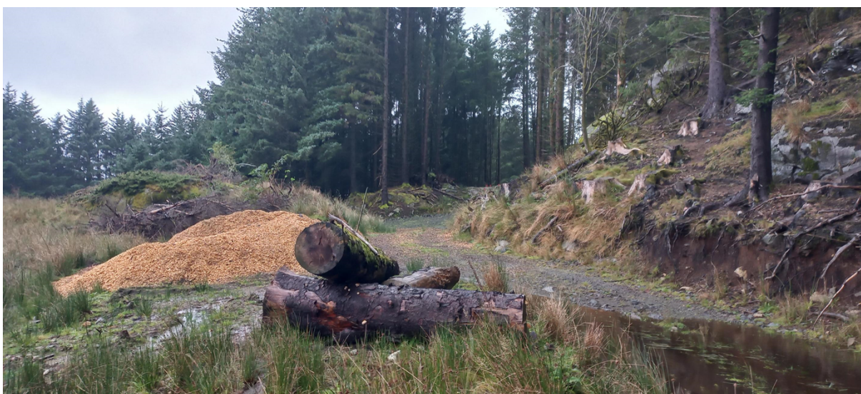
Fig. 2. På gnr. 437, bnr. 3 skal den nye vegen starte ved enden av eksisterande veg. Den vil gå gjennom granene midt i biletet. Steinen frå fjellet haugen skal nyttast til vegbygginga.