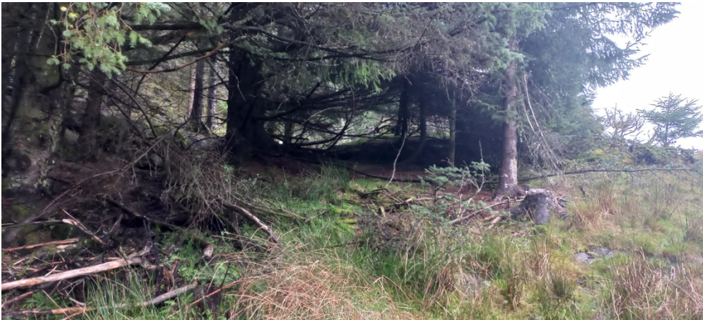
Fig. 3. Frå området i fig. 2 skal vegen gå mot fotografen, men til venstre i biletet før den held fram over fulldyrka jord og innmarksbeite mot grensa til gnr. 433, bnr. 4.