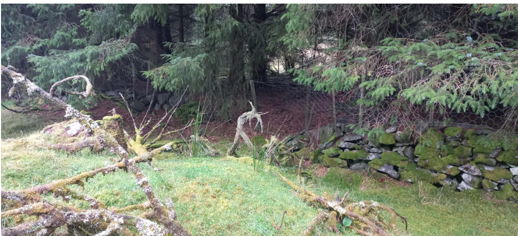
Fig. 5. Vegen er tenkt lagt gjennom opninga i steingarden. Bak grantrea skimtar vi beitet på gnr. 433, bnr. 4 der vegen skal halde fram.