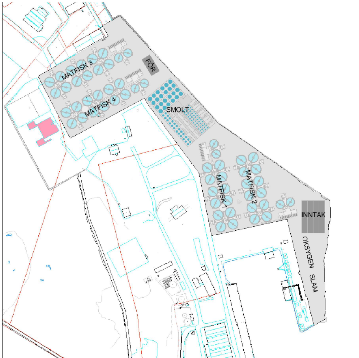
Figur 5. Skisse av hele det planlagte landbaserte anlegget med tilhørende infrastruktur slik som det framstår på søknadstidspunktet inntegnet på Mongstad i Alver kommune. Fra Artec Aqua AS.