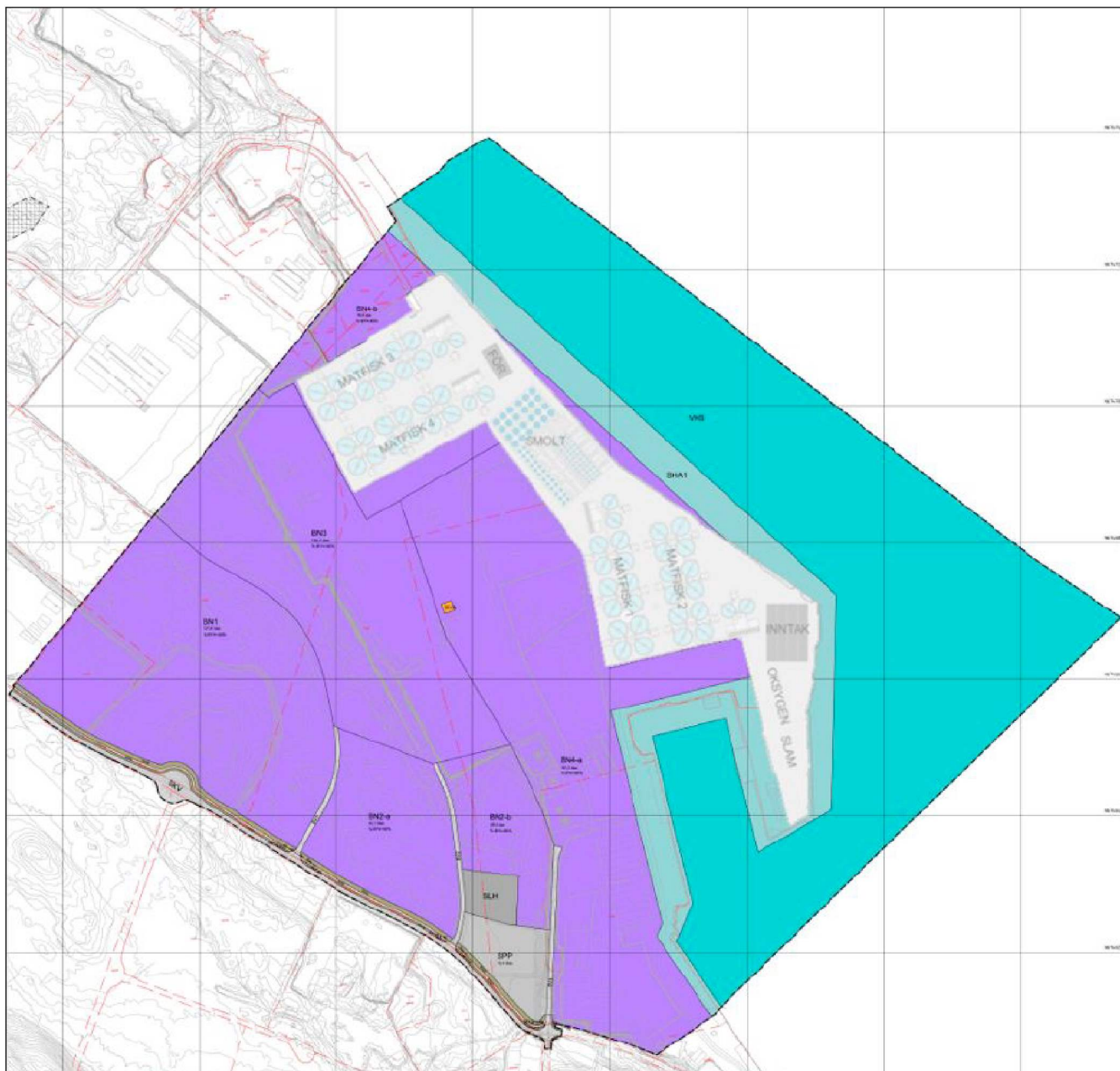
Figur 2. Planavgrensing for reguleringsplan "Grøn omstilling Mongstad" (PlanID 46312020006) og anleggets plassering innenfor avgrensingen.