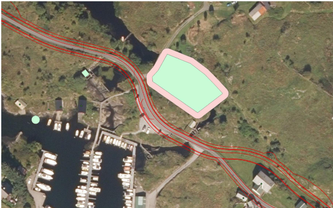
Figur 1. Raudt omriss viser plan, grøn og rosa markering viser automatisk freda kulturminne med tilhøyrande sikringssone.

Det må utarbeidast snitt og illustrasjonar som viser kva innverknader planforslaget med køyreveg, fortau og grønstruktur, vil ha for det automatisk freda kulturminnet. Det må også utarbeidast ein plan som sikrar kulturminnet i anleggsfasen. Først då kan Vestland fylkeskommune avgjere om kulturminnet er tilstrekkeleg sikra i planforslaget. Planområdet ved det automatisk freda kulturminne må få omsynssone c) (sosi-kode H570) med tilhøyrande føresegn som sikrar kulturminnet.