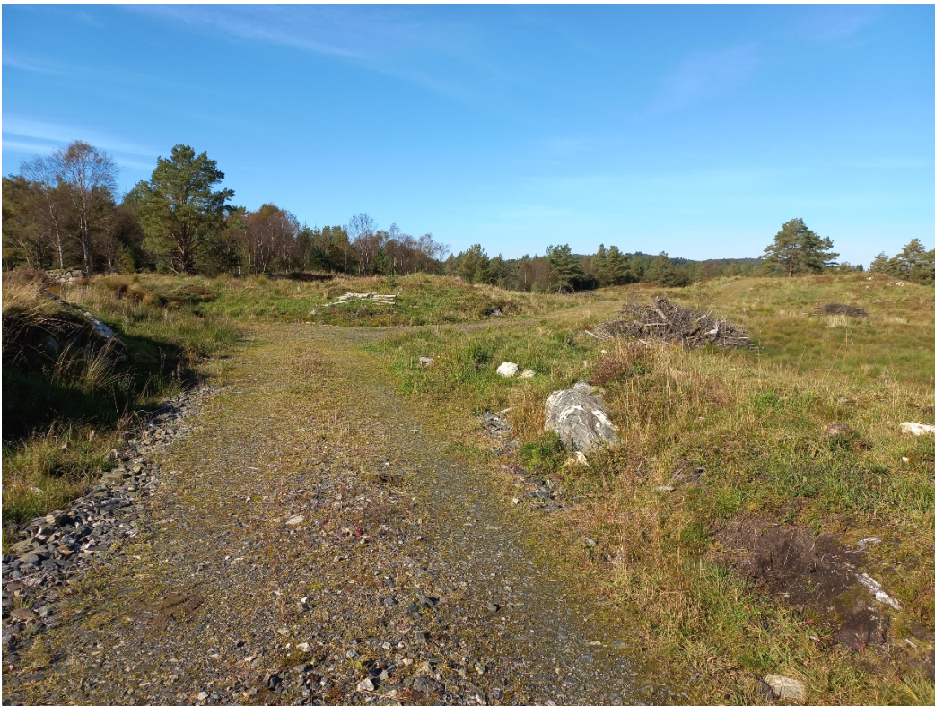
Fig. 2. I eit beite er vegen alt bygd. Den glir fint inn i terrenget.