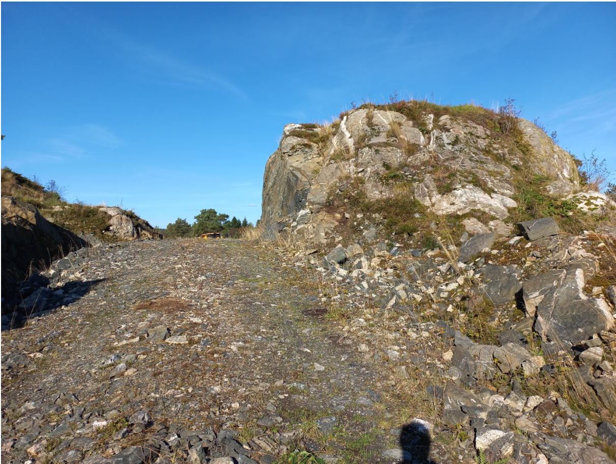
Fig. 3. Bergknausen til høgre skal sprengjast vekk og steinane nyttast i vegbygginga. Dette er merka av som massetak i søknaden/fig. 1.