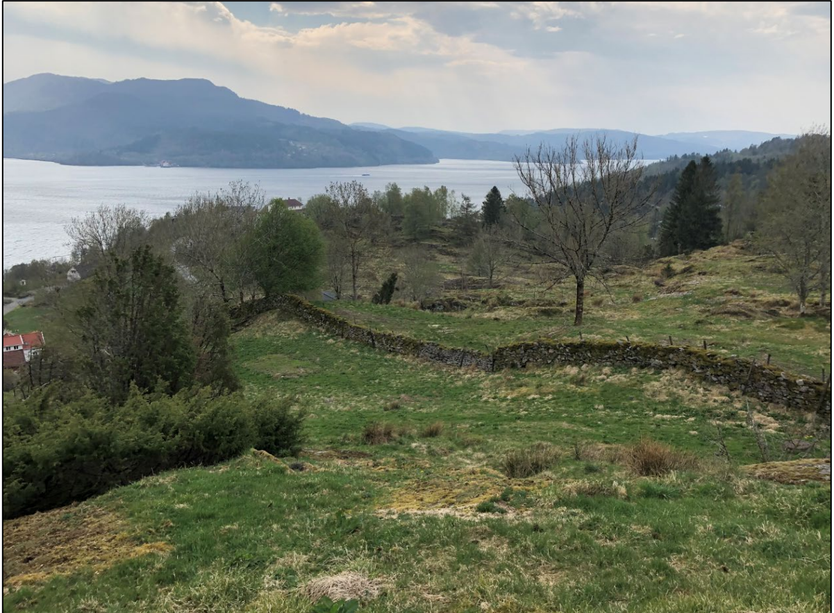
Figur 9: Beiteområde innenfor områdeformål bolig B8. Det nærmeste treet bak steingarden er en av de større askene.