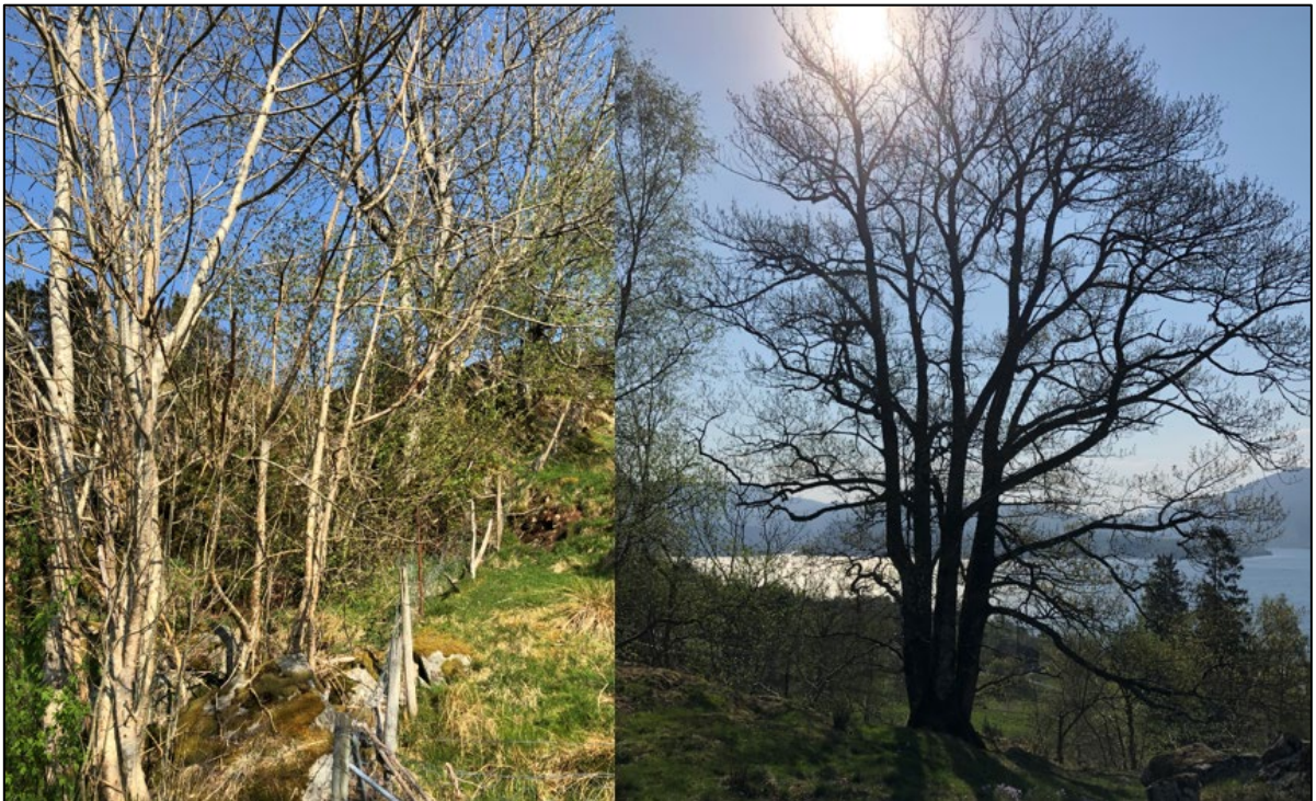
Figur 7: Bildet til venstre viser rekken med asketrær som går ned mot Eidavegen. Til høyre vises de hule eikene som er registrert i Naturbase fra tidligere, sør for Eidavegen.