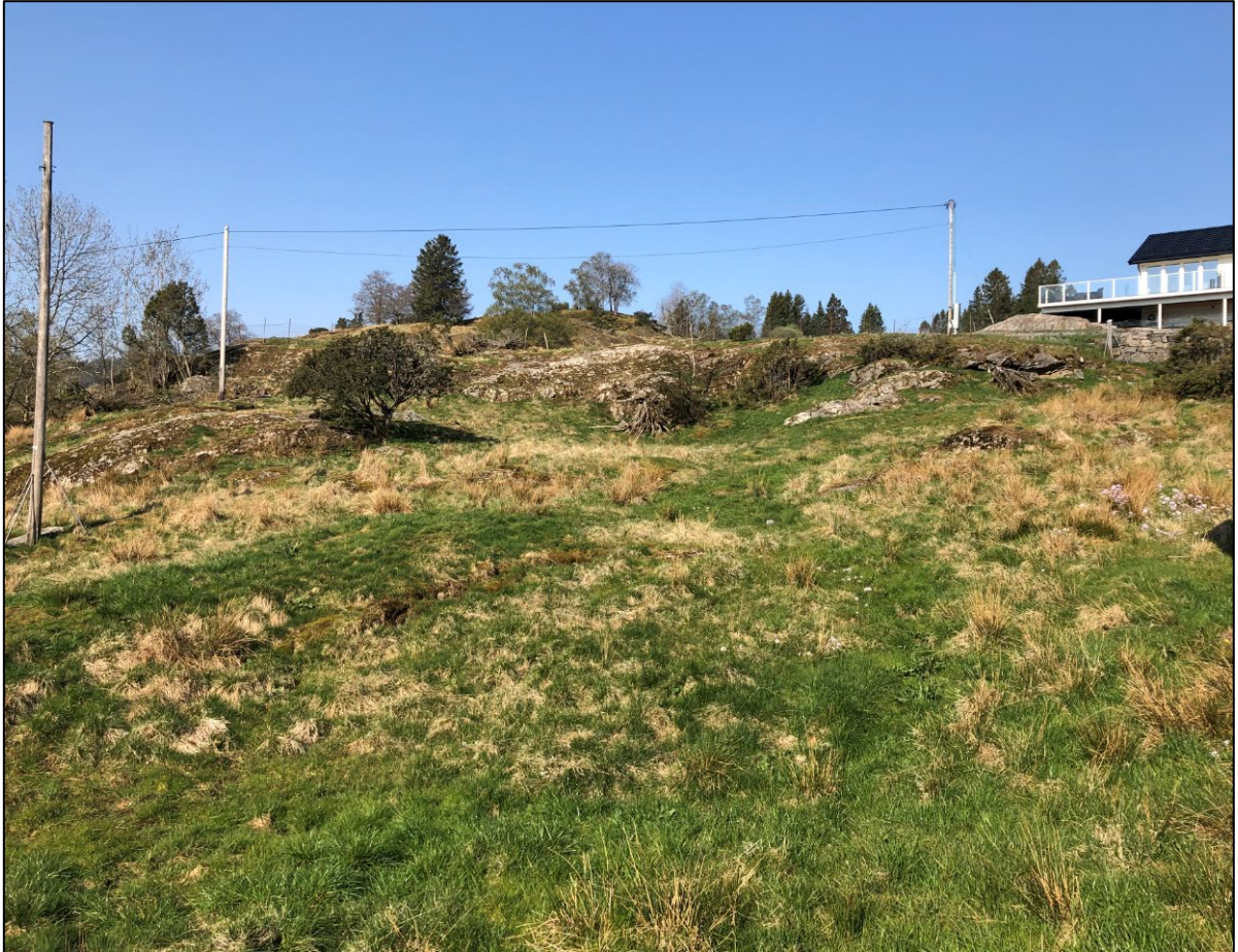
Figur 6: Beiteområde innenfor formål boliger B3. Bildet er tatt mot nord. Helt til venstre i bildet skimtes asketrærne som står på rekke ned mot Eidavegen.