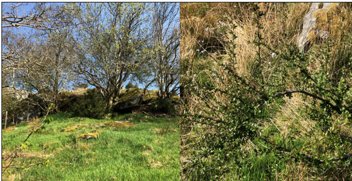
Figur 8: Bildet til venstre viser østlig del av beiteskråningen med hasseltrær. Til høyre vises sprikemispel som ble registrert i skråningens vestre del.

I søndre deler av B7 er det en bratt skråning med beitemark. Vestlig del av skråningen innehar stort sett tilsvarende vegetasjon som beiteområdet i B3. I tillegg ble det observert brennesle, stedvis bregner og ryllik (sparsomt). Lenger ned mot Eidavegen er det noen store seljetrær. Ellers er også dette beitet preget av mye lyssiv/knappsiv. Én sprikemispel ble også registrert. Østlige deler av skråningen er atskilt fra den vestlige delen av et gjerde. På østlig side av gjerdet er det mindre lyssiv og mer dominans av gressarter. I tillegg ble det registrert ca. 7 eldre hasseltrær med mange skudd (figur 8). Feltsjiktet rundt disse er relativt artsfattig, samt stedvis tilgrodd med lyssiv og einer, og kvalifiserer derfor ikke til vegetasjonstypen rikt hasselkratt i henhold til Fremstad og Moen /10/, som er en truet naturtype. I nordøstlig del av B7, på oversiden av skråningen, er et gammelt beiteområde som i dag er gjengrodd av unge hassel og bjørk.