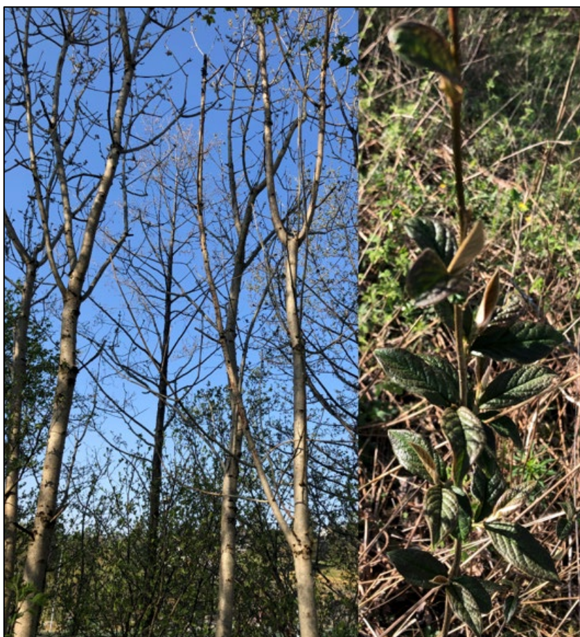
Figur 5: Ask (til høyre) og bulkemispel (til venstre) innenfor formål annen veggrunn SVG.

Helt øst/sørøst i planområdet finnes det enkelte arealer med løvskog og blandingsskog. Sør for skolebygget og vest for rundkjøringen er det et lite område med løvskog som grenser til barnehagen i sør. Her ble det registrert 6-7 asketrær, se figur 5. Ask er vurdert som sårbar (VU) i norsk rødliste pga. sykdom som skyldes soppen askeskuddbeger. Asketrærne er unge og ca. 5-6 m høye. Andre treslag var svartor, gråor og selje. Bunnsjiktet er relativt artsfattig. Det ble registrert en bulkemispel i nordenden av skogsområdet, se figur 5. Bulkemispel er i kategorien svært høy risiko (SE) på fremmedartslista 2018. Sørøst for samme rundkjøring er det en skråning med flere asketrær som er små til middels store, i tillegg til selje, furu, rogn og bjørk. Feltsjiktet er sparsomt grunnet mye blokk og berg, men arter som bjørnekam, ormetelg, og løvetann ble observert. Det ble også registrert én bulkemispel midt inne i skogen.