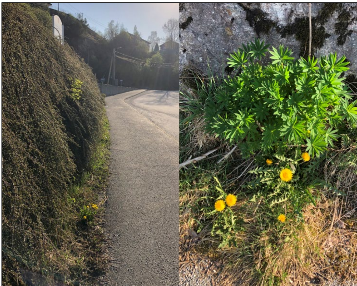
Figur 4: Krypmispel langs fortau (til venstre) og hagelupin (til høyre) innenfor formål undervisning BU.

Rett sør for sørligste skolebygg er det en grøntrabatt med krypmispel. Ca. 60 m nordøst for denne, langs veien, ble det også registrert hagelupin, se figur 4. Krypmispel og hagelupin er i kategorien svært høy risiko (SE) i fremmedartslista 2018.