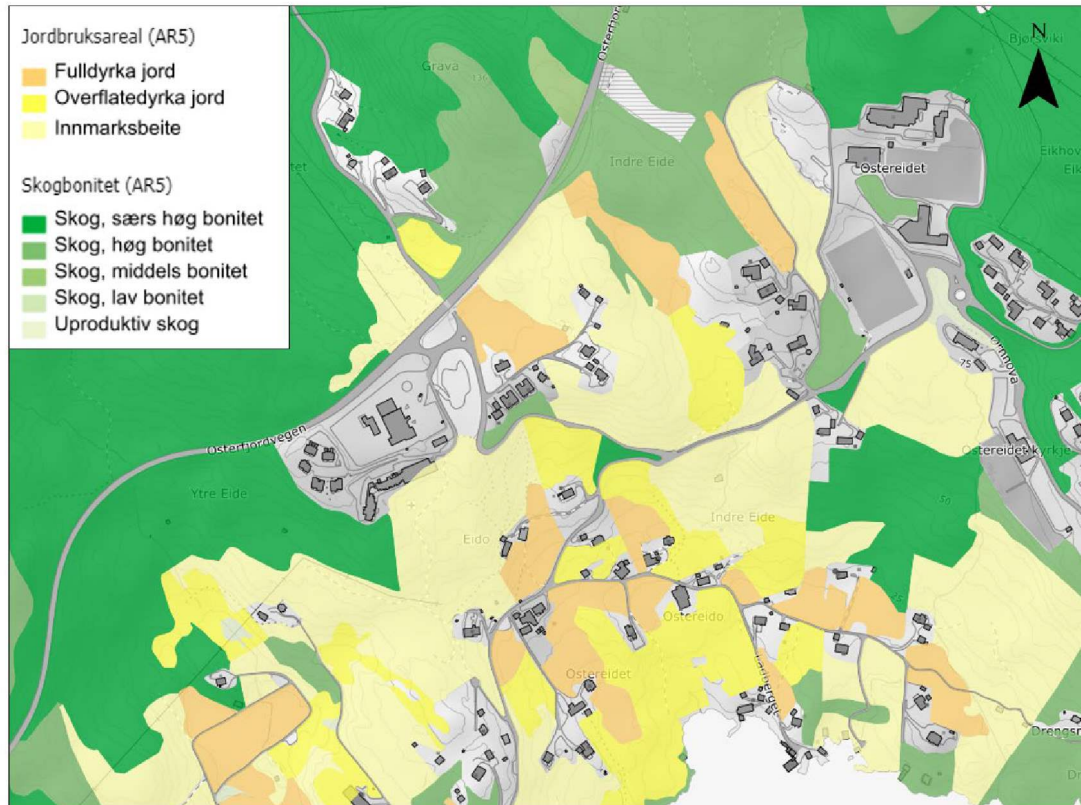
Figur 2: Jordbruksareal og skogbonitet.

Skog og landskap sin karttjeneste «Kilden» /8/ viser at området er preget av mye jordbruksareal, herunder innmarksbeiter, overflatedyrka og fulldyrka jord. Vest i tiltaksområdet er det en sørvendt skråning med barskog klassifisert med «særs høy bonitet». Ellers er det enkelte arealer av løvskog innenfor tiltaksområdet, klassifisert med særs høy eller høy bonitet, se figur 2.