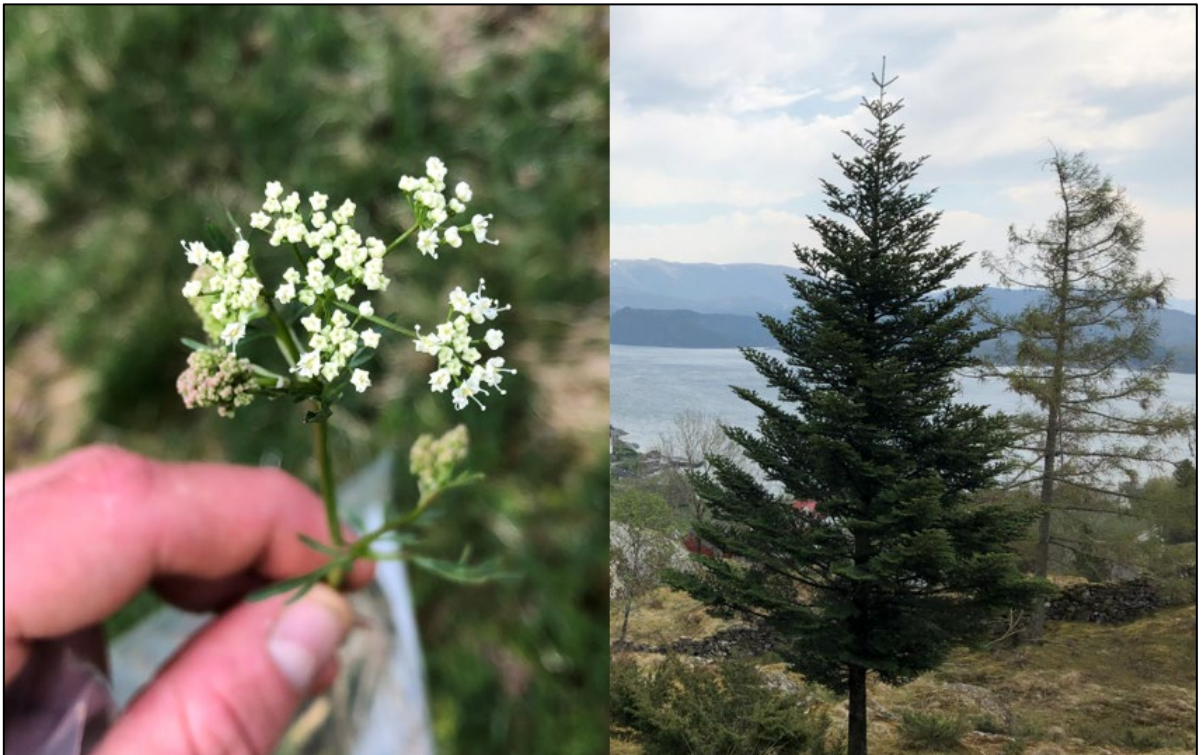
Figur 10: Bildet til venstre viser en av de få registrerte jordnøttene. Til høyre vises fremmedartene edelgran (fremst) og lerk (bak) i utkanten av beiteområde innenfor formål BO.