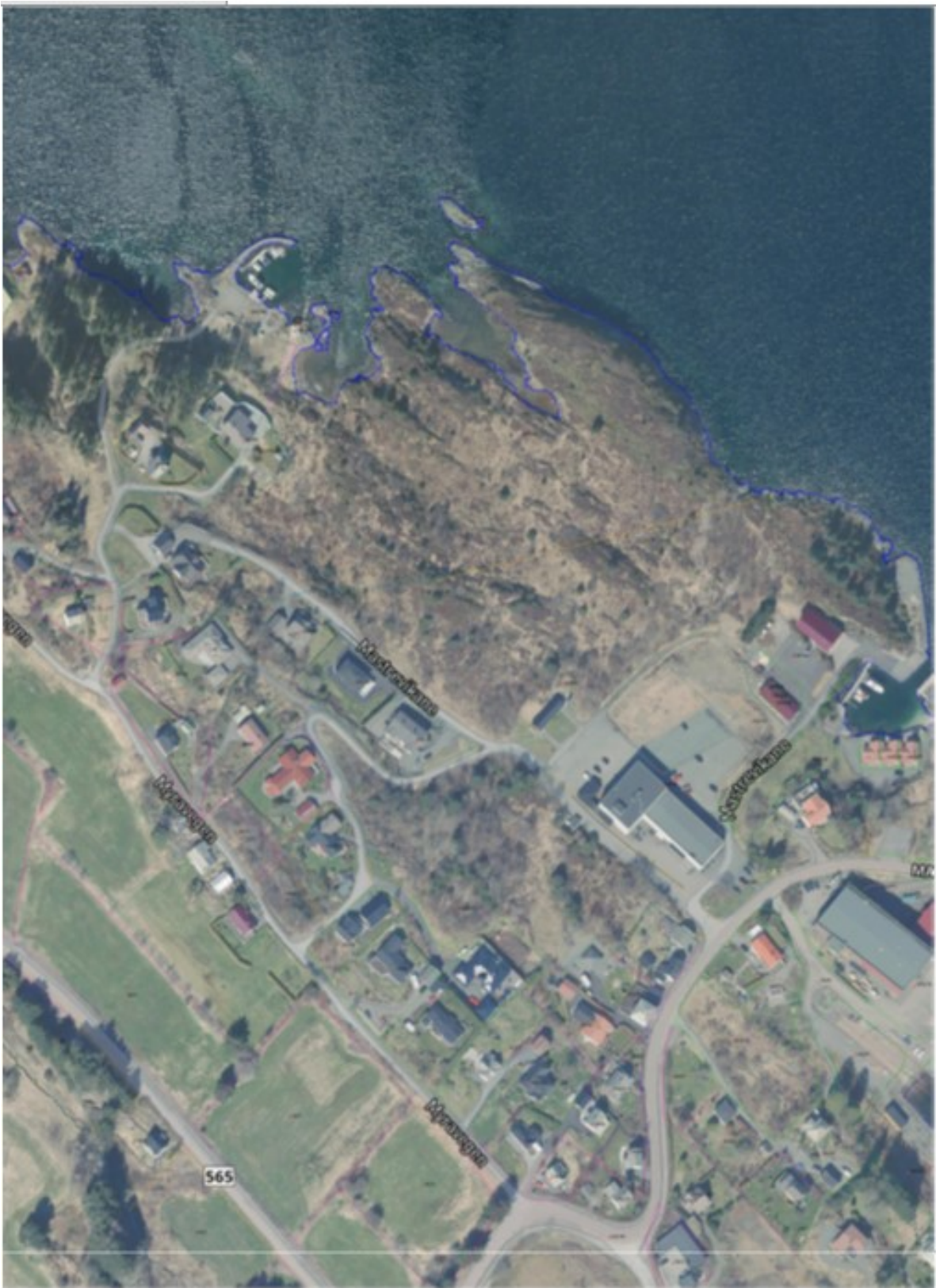
Flyfoto over planområdet