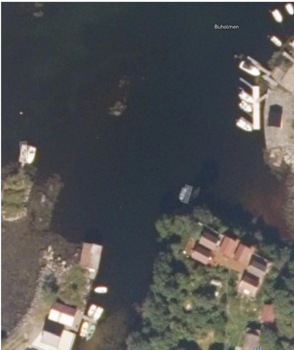
Situasjonsfoto over. Omsøkt flytebrygge ligg allereie ute.

Austrheim kommune ser at med å samla båtane i omsøkt område i ei flytebryggje vert arealinngrepet i sjøen mindre. Det vert tryggare for folk å kome til og frå båtane i all slags ver. Båtane vert og betre sikra mot vær og klima. Alternativet er at fritidsbustadene må legge ut blåsar og beslagelegge meir areal i sjø for å sikre båtane sine. Tiltaket er ikkje til ulempe for friluftsliv, ålmenta, fiskeri eller for biologisk mangfald i området.