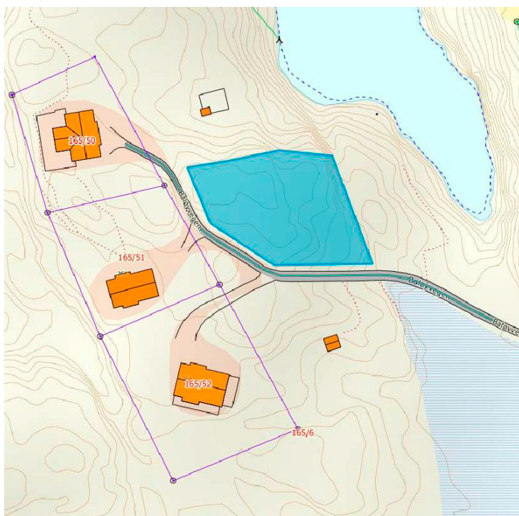
Omsøkt hyttetomt (blå farge) er ved tilkomstvegen og attmed dei tre hyttene som er i området