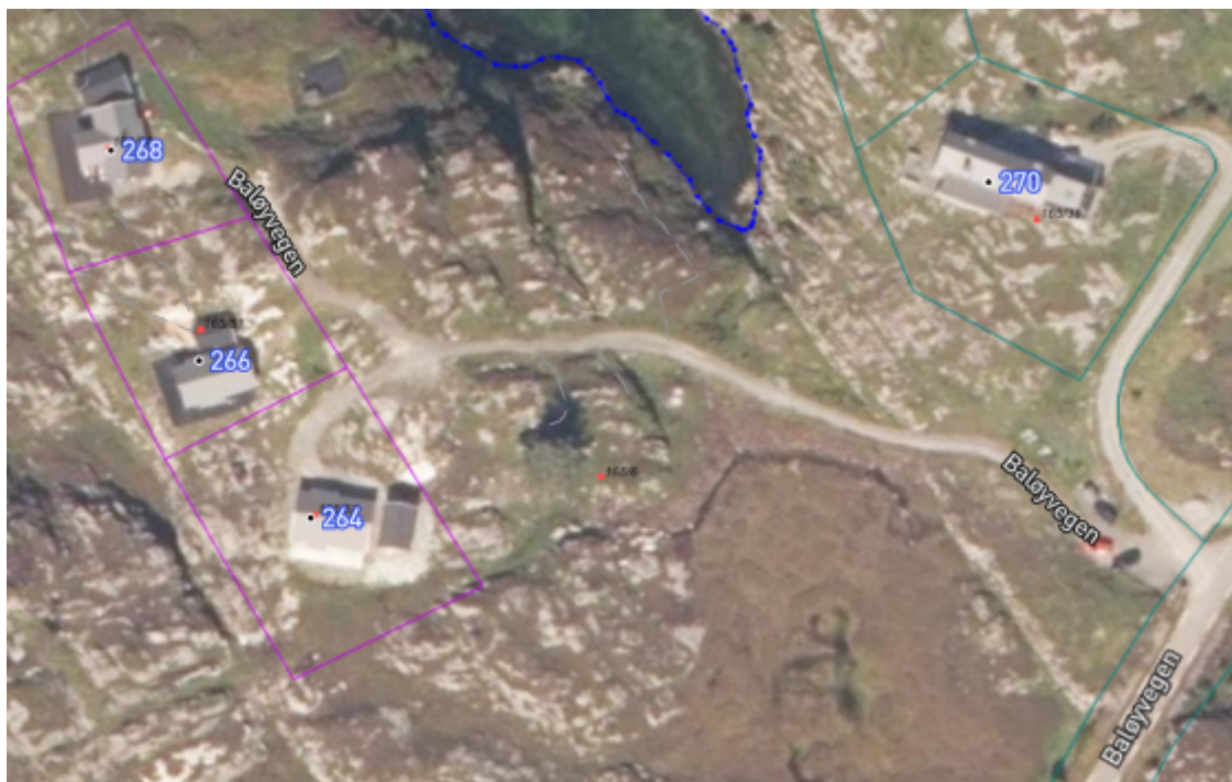
Fotokart over dei tre hyttene og vegane i planområdet