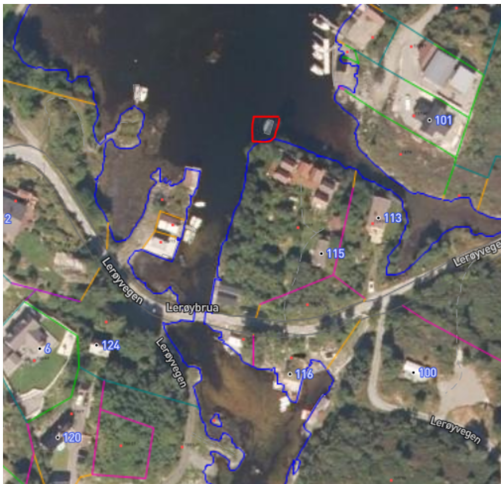
Utsnitt frå omsøkt område. Omsøkt flytebrygge markert med raudt