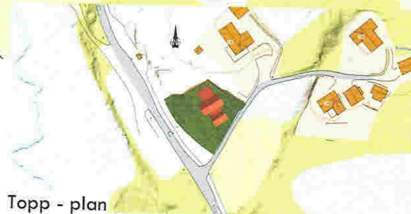
Topp - plan