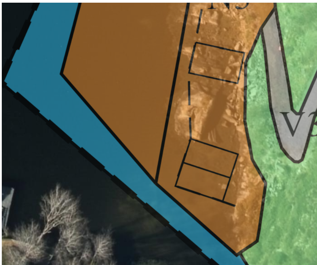
Utsnitt frå Reguleringsplanen

Kommunen kan ikkje sjå att omsøkt flytebryggje hald seg innanfor reguleringsplanens føremål om Småbåtanlegg i sjø. Plan-id er 2006005.